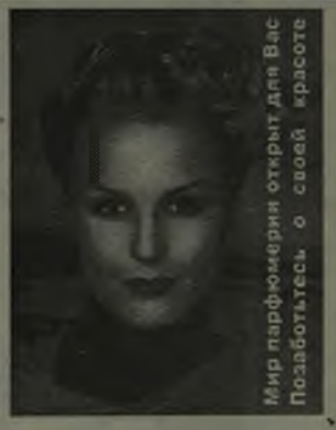
Мир парфюмерии открыт для Вас. Позаботьтесь о своей красоте.

(659) Продается Шкода - Фаворит, 1991 года выпуска. Обращаться по телефонам: 2-18-95 (с 19-00 до 20-00 часов), 9-14-56 (с 8-00 до 16-00 часов).