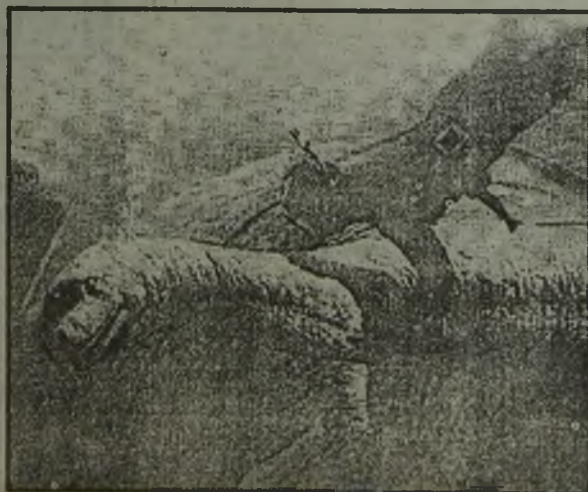
Несси со своим детенышем Дино (аверу).

Перед вами уникальные фотографии. Что это — невероятная правда или ловко выполненная подделка?