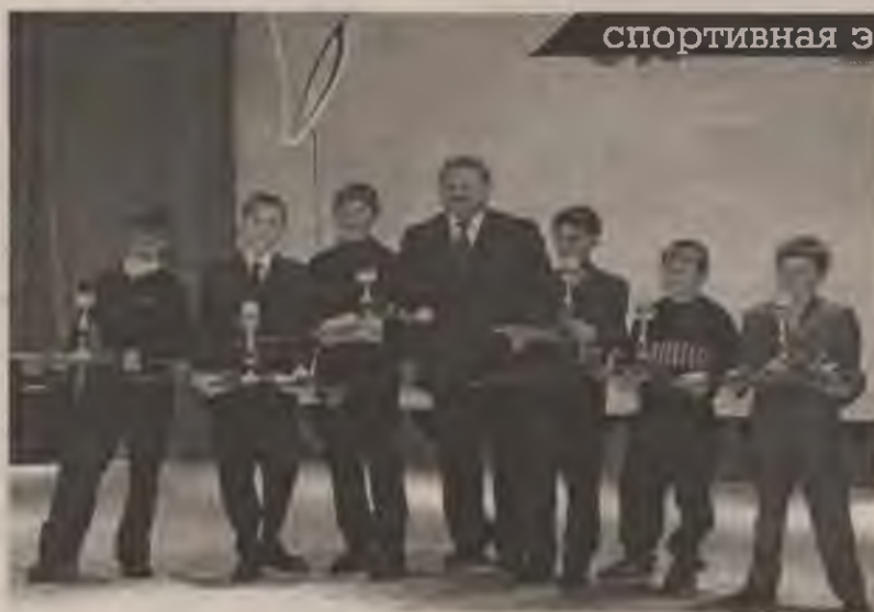
спортивная элита — 2003

— Спорт всегда являлся одним из приоритетных направлений в развитии Мегиона. Радует, что наши спортсмены не сбавляют набранных темпов, добиваются все более высоких результатов, получают звания, все больше становится у нас разрядников и мастеров спорта. Сегодня мы поощряем лучших, самых выдающихся спортсменов, но прекрасно понимаем, что надо больше вкладывать в развитие массового спорта. Администрация совместно с городской Думой ищет для этого возможности: ведется реконструкция и расширение спорткомплекса «Олимп», будет сдан в этом году современный спортивный зал в лицее. Конечно, этого недостаточно, чтобы удовлетворить все потребности, но в перспективе планируется строитель-