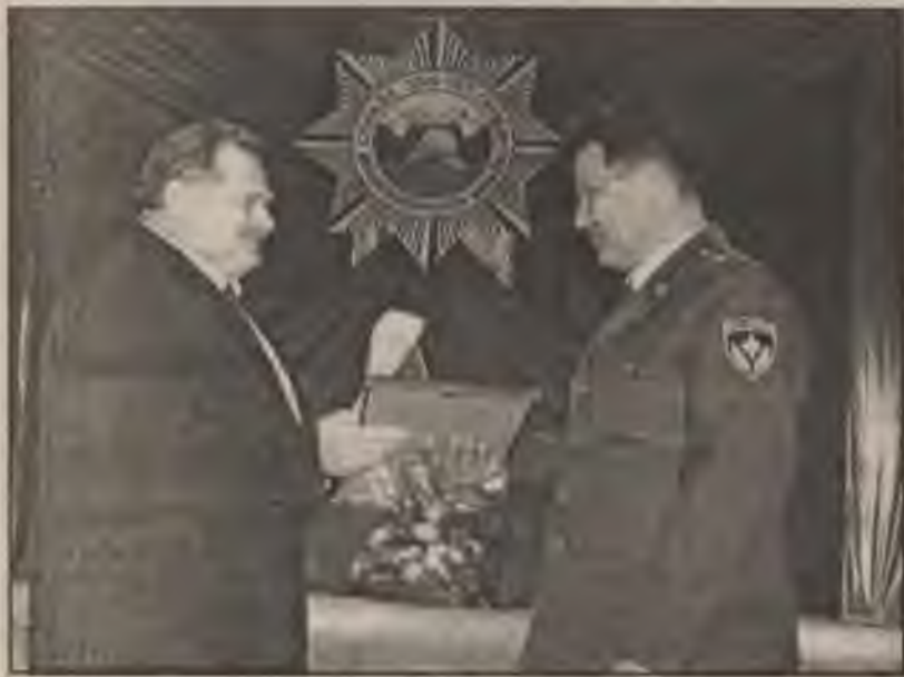
Торжественный вечер, посвященный 355-й годовщине образования Государственной противопожарной службы, состоялся 30 апреля в ГДК «Прометей».