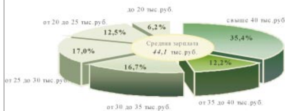
Распределение численности работников ОАО "СН-МНГ", отработавших полный месяц, по уровням заработной платы за 2008г.