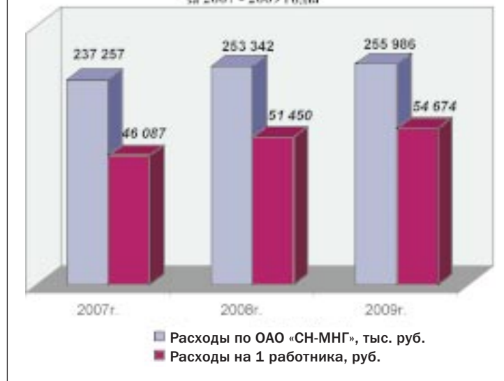
Динамика расходов на социальные гарантии, льготы, компенсации по Коллективному договору ОАО "СН-МНГ" за 2007 - 2009 годы

В соответствии с Положением о порядке оплаты за лечение и протезирование зубов работникам ОАО «СН-МНГ» произведена оплата за лечение и протезирование зубов 24 работникам.