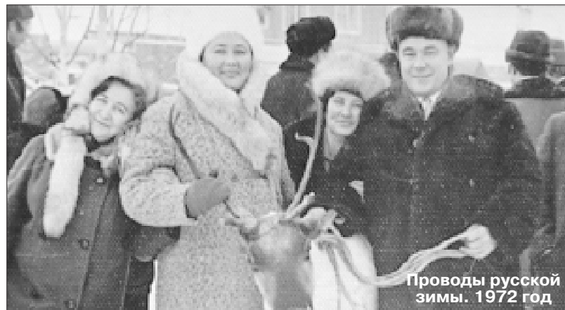
Проводы русской зимы. 1972 год

деревни от центра страны, где проходили основные сражения, нас не бомбили, но дыхание войны чувствовалось во всем.