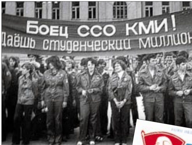
Студенческие строительные отряды (ССО) приезжали во все уголки страны на большие и серьезные стройки. БМ, гидроэлектростанции, заводы и города – везде есть немалая часть студенческого труда

Между студенческими отрядами проводились соревнования. Учитывались и производственные показа-