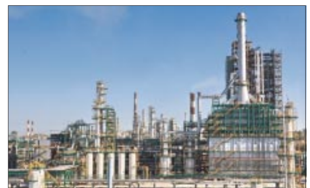
Департамент общественных связей и региональных проектов ОАО «НГК «Славнефть».

Объем производства автомобильных бензинов за отчетный период уменьшился на 11,1 % по сравнению с первым полугодием 2009 года и составил 2,0 млн тонн. В том числе на ЯНОСе – 1,06 млн тонн (снижение на 5,7 %), на Мозырском НПЗ – 0,94 млн тонн (снижение на 16,5 %). Сокращение объема выпуска автомобильных бензинов на ЯНОСе в первом полугодии 2010 года было предусмотрено бизнес-планом предприятия и связано с плановым ремонтом ряда производственных установок. До конца года предполагается компенсировать эти потери за счет увеличения объемов производства.