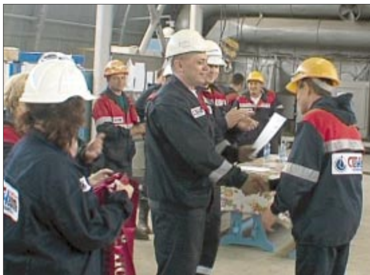
Подготовила Гузель ХАЙРУЛЛИНА.

Смотр-конкурс «Лучший по профессии—2010» успешно завершился. Впереди участников ждут новые победы. Остается напомнить, что в работе нефтяника нет ничего второстепенного и любая мелочь, по большому счету, решающая. Именно такой подход к делу помогает добиться успеха.