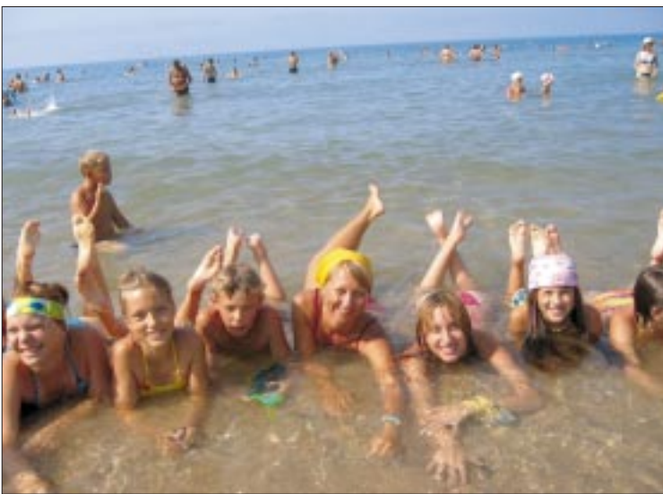
На реализацию программы отдыха детей работников предприятия ОАО «СН-МНГ» планирует направить свыше 12,6 млн рублей

(как и затраты на проезд в Сочи) практически полностью брало на себя предприятие. Судя по озвученным Вами суммам, эта практика сохранилась? Напомним, кто может рассчитывать на такой отдых.