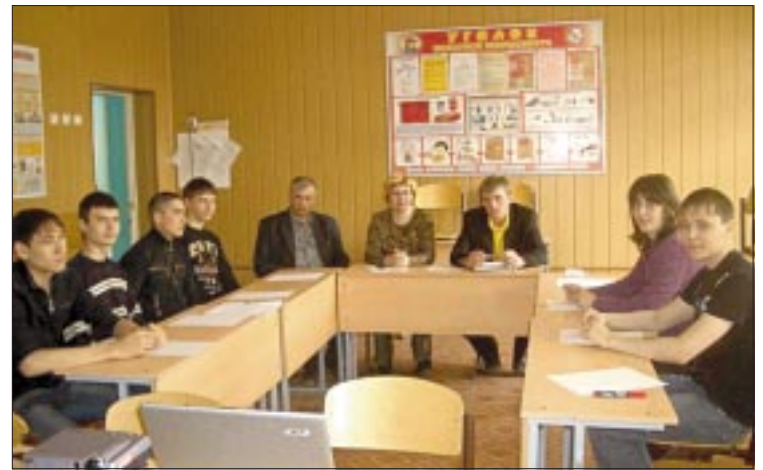
Помимо практики для студентов СППК регулярно организуют встречи с производственниками, на которых будущие нефтяники могут задать все интересующие вопросы

— В СППК нет своей технической базы, где бы учащиеся получали профессиональные навыки, поэтому очень важно, что они могут пройти практику в ОАО «СН-