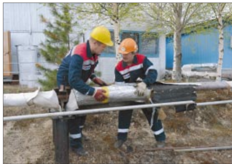
По завершении отопительного сезона теплоэнергетики приступили к ремонтным работам

Сегодня «ТеплоНефть» — это более пятидесяти километров теплосетей и свыше десятка котельных, которые расположены на всех месторождениях акционерного общества «Славнефть-Мегионнефтегаз». Чтобы этот гигантский комплекс работал как часы, различным профилактическим мероприятиям на предприятии уделяют самое серьезное внимание. Уже сегодня теплоэнергетики начали подготовку к предстоящей зиме. За полтора летних месяца им необходимо выполнить колоссаль-