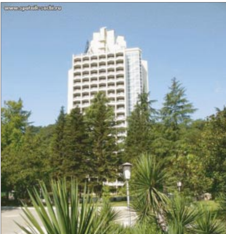
В этом году передовиков производства вновь ждет сочинский курортный комплекс «Спутник»

– В 2009 году нефтяникам предоставлялись путевки, оплату которых