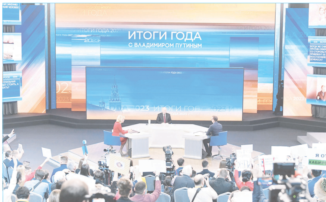
Разговор с президентом длился 4 часа 4 минуты. Глава государства за это время успел ответить на 67 вопросов

"Цифры, которые привел президент, говорят о том, что Россия достойно выдержала все нападки Запада. То же можно сказать и про экономику нашего региона. Она выстояла, перестроилась и адаптировалась, невзирая на санкции. Югра, как и прежде, продолжает обеспечивать энергетическую и экономическую безопасность страны. Автономный округ входит в десятку регионов-лидеров по состоянию инвестиционного климата, а инвестиции - это стратегический маховик, который стимулирует экономический рост. Дума приняла бюджет развития. 68,3% его расходов будут направлены на социальную сферу. Это образование, спорт, медицина, строительство дорог и исполнение всех обязательств - как перед военнослужащими и их родными, так и перед всеми югорчанами".