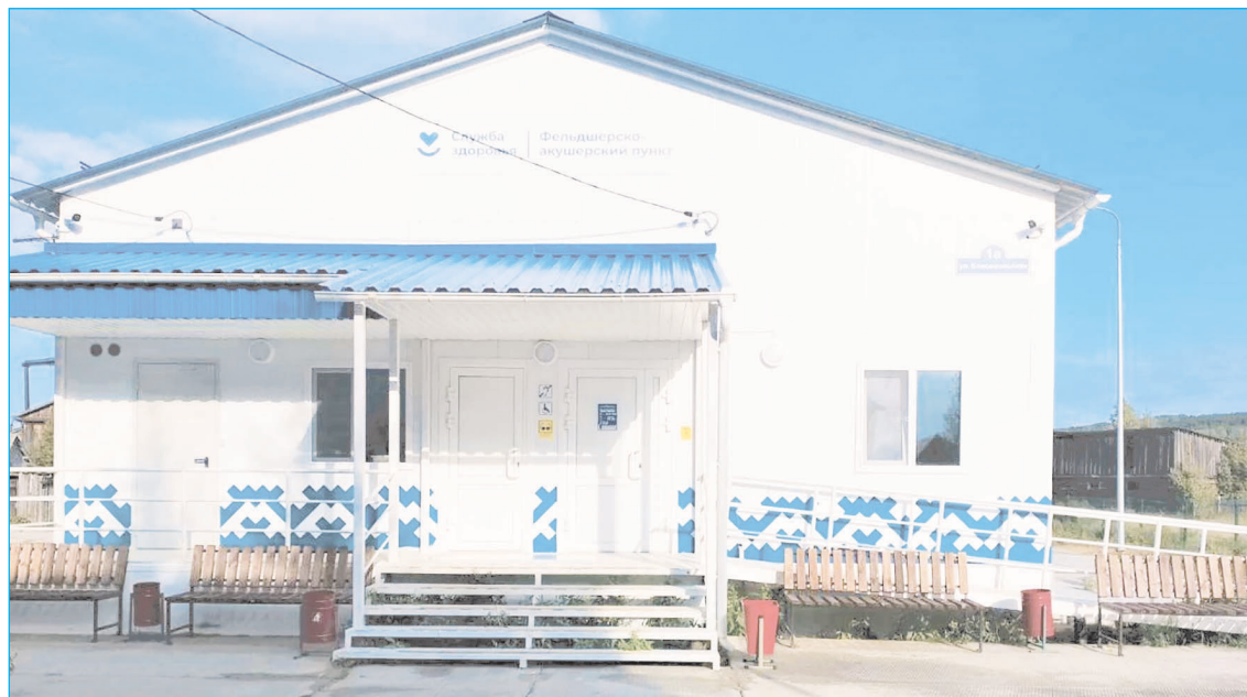
Югра занимает 3 место по качеству медпомощи среди регионов страны

менялись: нейтральный статус Украины, ее денацификация и демилитаризация - это справедливые требования России, необходимые для обеспечения безопасности страны. Президент признает, что конфликт на Украине - это трагедия, он похож на гражданскую войну между братьями, потому что русские и украинцы в своей основе - один народ. Но сложившаяся ситуация - это плод работы киевского режима и его западных покровителей, на протяжении многих лет готовивших почву для столкновения. Если Киев и его западные спонсоры не хотят решать конфликт дипломатически, то наша армия достигнет всех целей СВО на поле боя. В зоне спецоперации сейчас - больше 600 тысяч человек, очень много добровольцев. При этом для России очень важно беречь наших бойцов, никакой потребности в новой мобилизации нет. "Уверен, что победа будет за нами, общая", - сказал Владимир Путин.