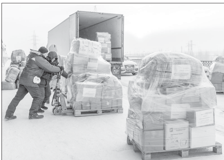
Посылки со всех муниципалитетов Югры отправляют на склад в Сургут, оттуда - в Донбасс

"КОРОБКА добра" и "Посылка солдату" - это две добрые акции гумкорпуса по сбору необходимой помощи. Их разница в том, что военным передают продукты, которые готовы к употреблению, а мирным жителям новых регионов - продукты, например, макароны, муку, рис, масло, из которых можно готовить блюда.