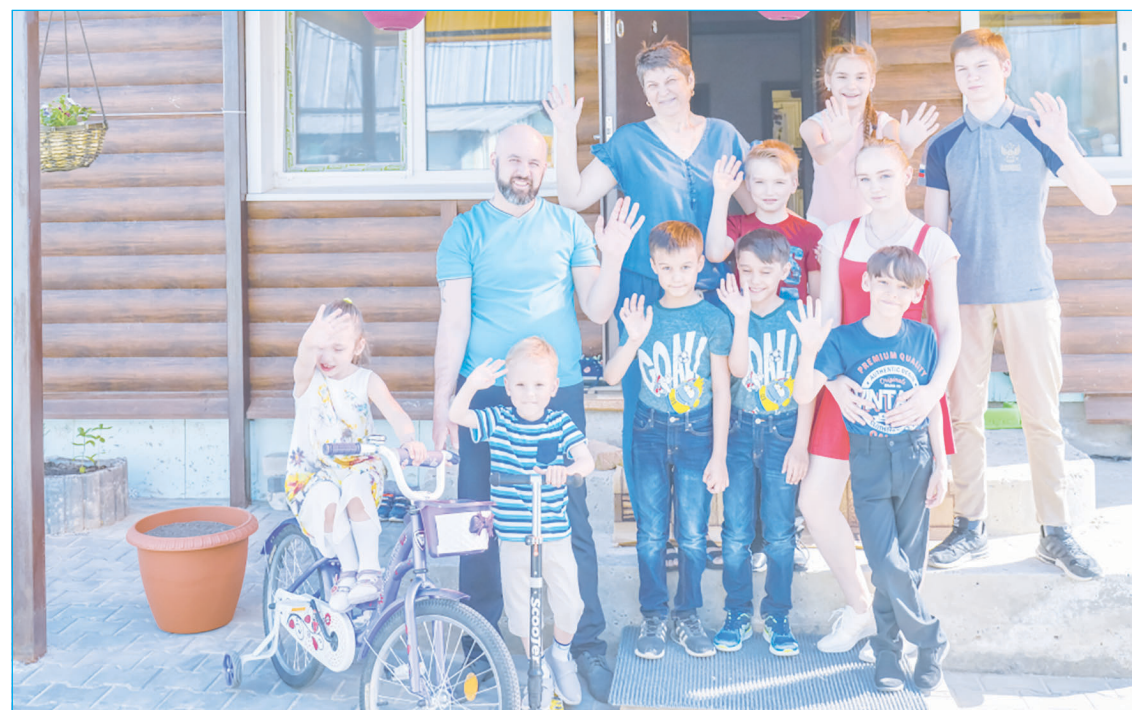
Каждая девятая семья в нашем регионе - многодетная

Владимир Путин сообщил, что банки перестанут брать комиссию за оплату услуг ЖКХ с пенсионеров, такое решение уже принято. Он также уточнил, что пенсии в 2024 году будут проиндексированы на 7,5%, в июле 2024 года запланирована третья индексация пенсии за последние 1,5 года.