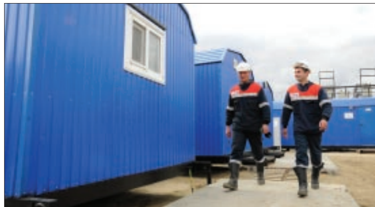
Передвижные вагон-дома оснащены всем необходимым для полноценного пребывания персонала на месторождении

Отдельно стоит отметить, что весь процесс разработки и обустройства территории ведется при строгом соблюдении законодательных требований в области экологии, промышленной безопасности и охраны труда. Месторождение находится в пойменной зоне, сохранению ее флоры и фауны со стороны предприятия уделяется повышенное внимание на всех этапах