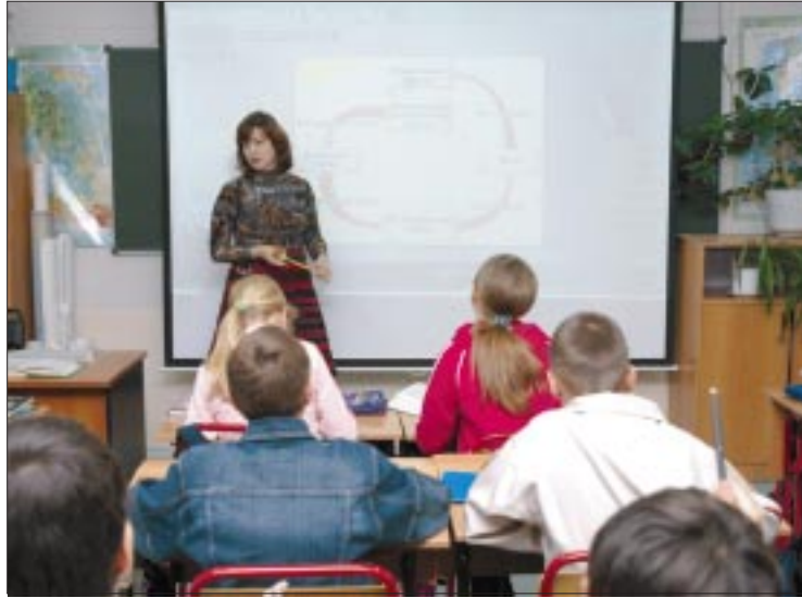
Благодаря работе депутатов в бюджет города дополнительно поступило около 170 миллионов рублей

практически невозможно. Городской парламент в силу своих полномочий идет нам навстречу. В частности, этим летом истекает срок выкупа арендованных у муниципалитета помещений. Но из-за возникших проблем не у всех есть такая возможность. Наша Дума выступила с инициативой продлить срок еще на год. Если предложение мегионских депутатов будет поддержано на окружном и федеральном уровне, многим предпринимателям это станет существенным подспорьем.