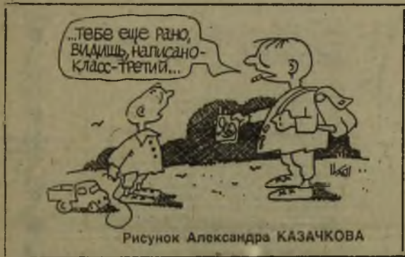
Рисунок Александра КАЗАЧКОВА

Голузин немедленно написал Отцу Инокентию письмо, в котором изъявил желание уплатить автору лечебника любую сумму. Пришлось ответить добрейшему соотечественнику, что никакой платы не нужно.