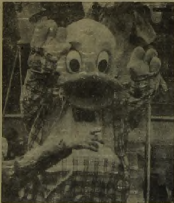
На снимках: американские мультигерои среди мегионской ребятни.