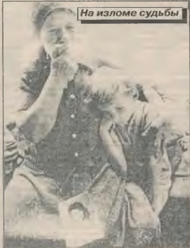
На изломе судьбы