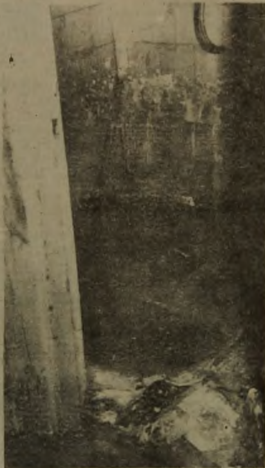
Так называемая "душшева". Удивительно оптимистично-приятно качество нашей с вами жизни. Не правда ли?