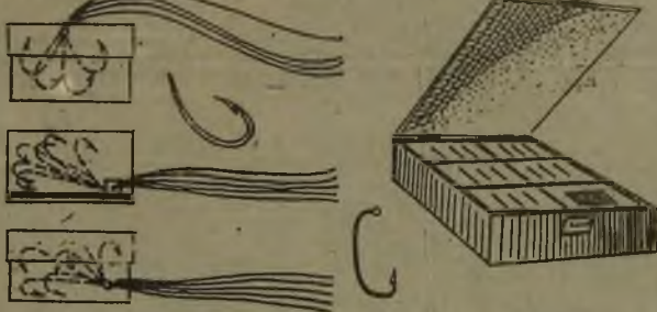
На рисунках 18 и 19 виды коробочек для хранения крючков и мормышек.

Но вот приведены в порядок крючки. Теперь их необходимо так уло-