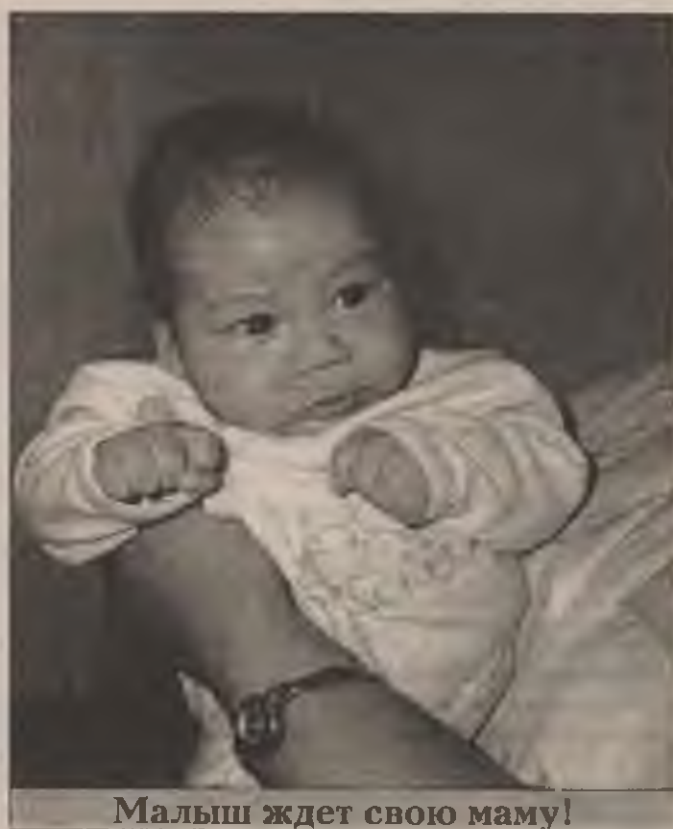
Малыш ждет свою маму!