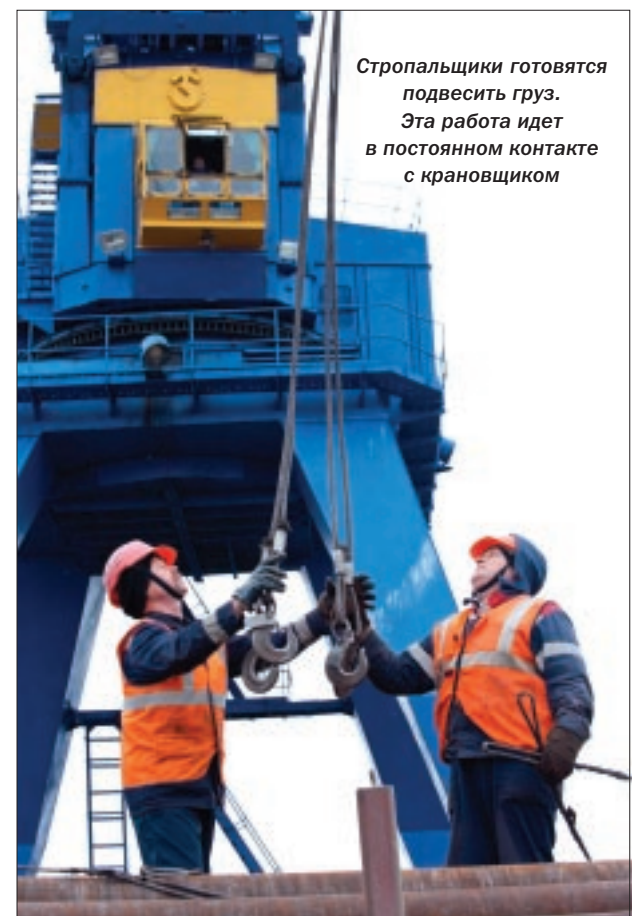
Стропальщики готовятся подвесить груз. Эта работа идет в постоянном контакте с крановщиком

С наступлением зимы у стропальщиков начинается ответственный период, так как основную работу они выполняют на открытом воздухе. Теперь в течение всего холодного се-