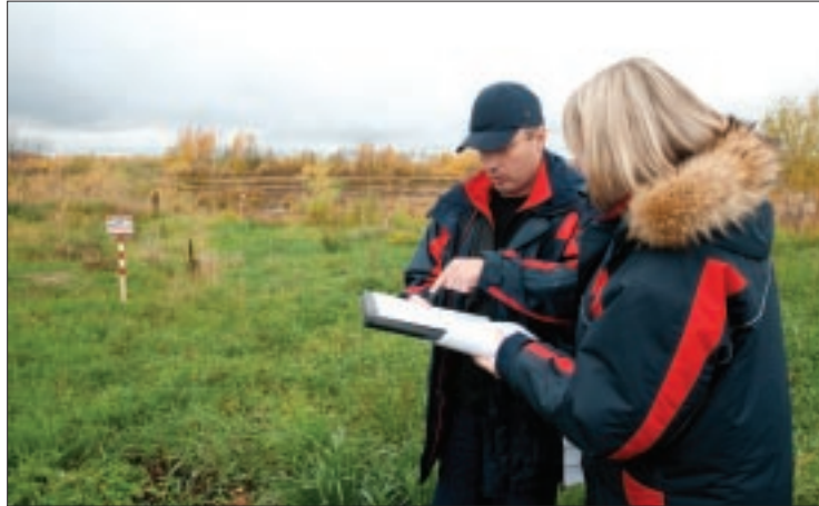
В ходе визуального обследования госинспектор не только оценивает качество травяного покрова на рекультивированных участках, но и сверяет их координаты с проектными документами