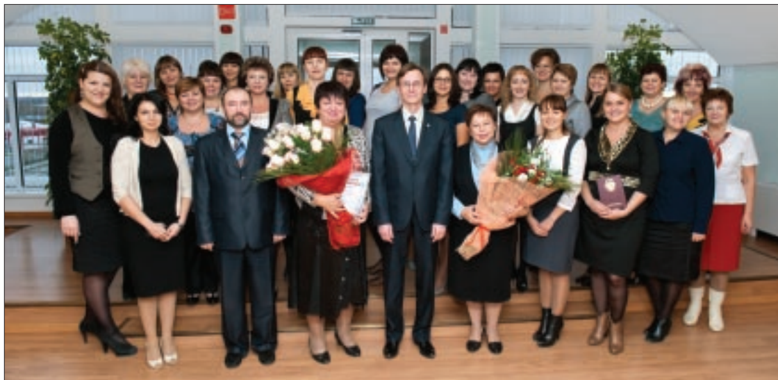
Окончание. Начало на стр. 1.

И развивать его могут только профессионалы высокого класса