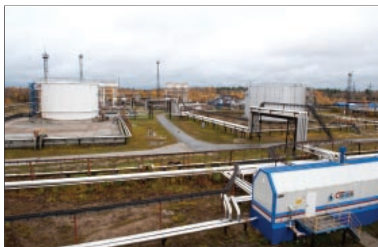
На производственных объектах, таких как ЦППН или ДНС, наряду с основными мерами безопасности в зимний период выполняются мероприятия по утеплению пожарных гидрантов, трубопроводов, запорной арматуры