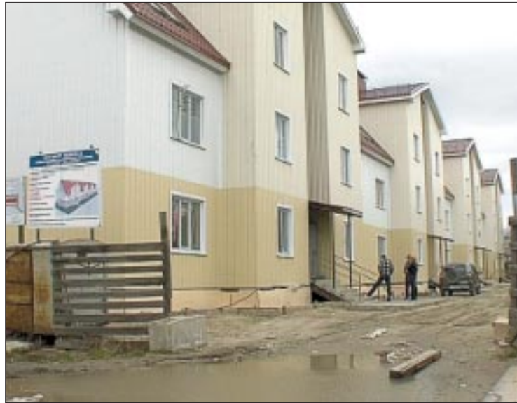
Дольщики жилищного кооператива «Мегион» вынуждены жить в недостроенных домах

Разобраться в ситуации с ЖНК «МЖК «Мегион» накануне пытались и власти города. По этому случаю собрали даже расширенное совещание. За столом руководители администрации, правоохрани-