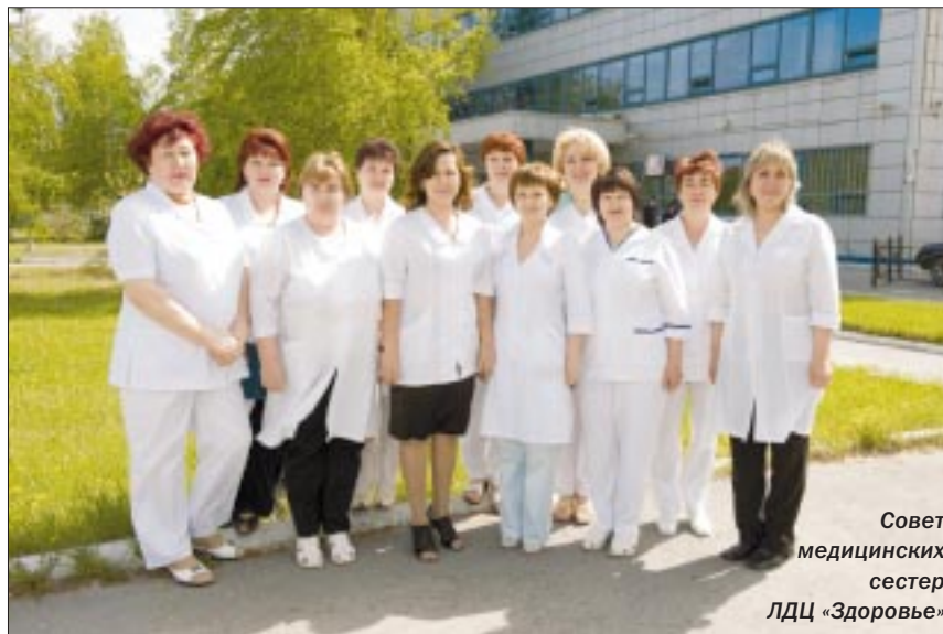
Совет медицинских сестер ЛДЦ «Здоровье»

Одним словом, работа в Совете медицинских сестер для всех его членов — это не просто обществен-