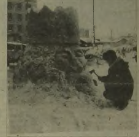
Мегнон готовится к празднику