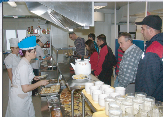
Открытие столовой на Ачимовском месторождении прошло торжественно и даже с соблюдением русских традиций – первых посетителей встречали хлебом-солью

тают, пожалуй, и те, кто видел Чистинное, Тайлаковское и Ачимовское месторождения в первые месяцы освоения. Когда дороги представляли собой болотную жижу, а о горячей воде из крана можно было мечтать. Сегодня все эти бытовые неурядицы в прошлом.