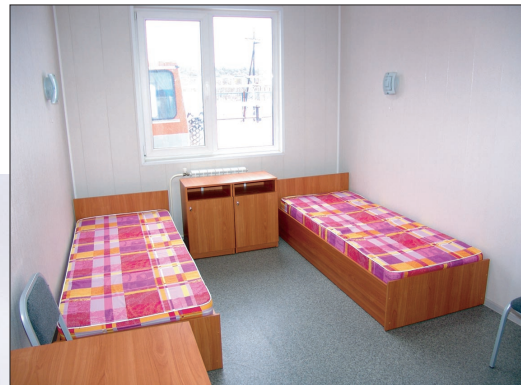
Комфортабельные общежития отвечают всем современным требованиям. В скором времени здесь появится тренажерный зал и спутниковое телевидение