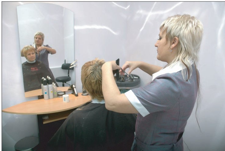
Модная стрижка — залог успеха

Начать стоит с маникюра, который необходим не только для красоты, но для здоровья кожи рук и ногтевой пластины. В «Жемчужине» можно сделать как классический обрезной, так и современный SPA-маникюр. Любительницам необычных вариантов предложат картины на ногтях. Для поддержания красоты и молодости кожи рук мастера рекомендуют парафинотерапию. После такой маски достигается эффект «бархатных ручек». Все материалы, которые используют в салоне «Жемчужины», только профессиональные, а они особенно продуктивно выполняют свои функции: лак дольше держится, а крема обеспечивают более глубокое увлажнение и питание. В «Жемчужине» работают два мани-