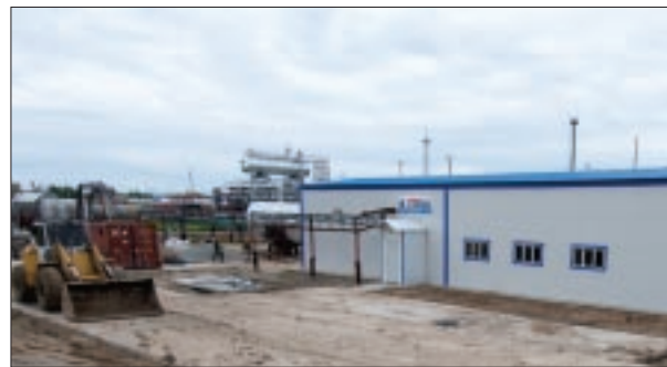
Новая станция водоочистных сооружений на Аганском месторождении позволит обеспечить постоянное снабжение работников нефтепромысла чистой питьевой водой

Более комфортным в скором времени будет пребывание работников и на Ватинском, Северо-Покурском и Аганском место-