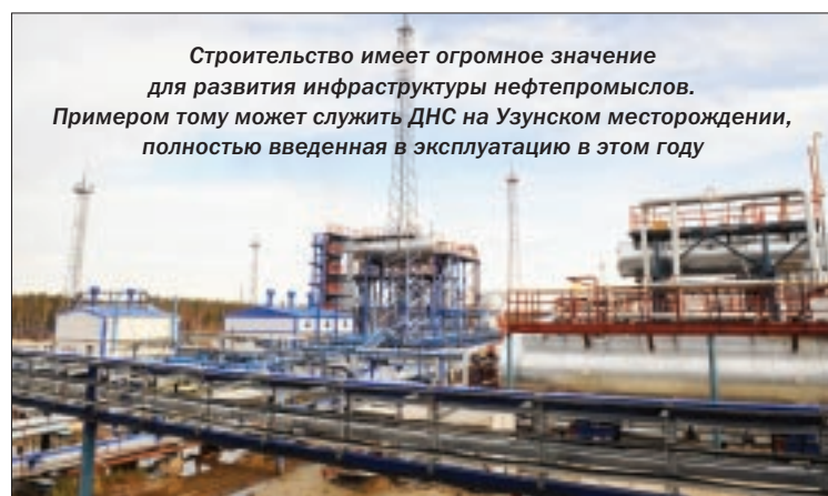
Строительство имеет огромное значение для развития инфраструктуры нефтепромыслов. Примером тому может служить ДНС на Узунском месторождении, полностью введенная в эксплуатацию в этом году

рождениях. Там строятся водоочистные сооружения (ВОС). Пока воду для нефтяников на Ватинский, Северо-Покурский и Аганский лицензионные участки привозят. А с вводом в эксплуатацию ВОС на этих нефтепромыслах будет полностью решена проблема с постоянным обеспечением чистой питьевой водой.