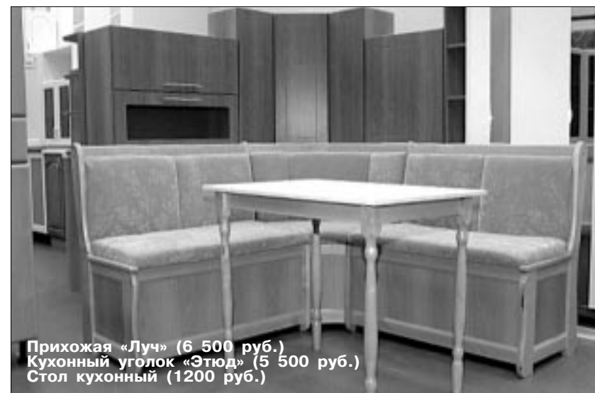
Прихожая «Луч» (6 500 руб.) Кухонный уголок «Этюд» (5 500 руб.) Стол кухонный (1200 руб.)

Диван-кровать «Гамма» — 6 450 — 8 700 руб. Стол журнальный — 1 800 — 3 750 руб. Набор корпусной мебели «Виконт-М» — 18 700 — 21 900 руб. Набор корпусной мебели «Премьер-5» — 33 650 руб. Стол обеденный «Иван» — 2 500 — 3750 руб. Тумба для обуви — 2 450 руб. Тумба для радио «Виконт» — 2 150 руб. Набор спальной мебели «Милена» — 19 000 — 27 800 руб. Матрац двойной «Милена-25» — 4 850 руб.