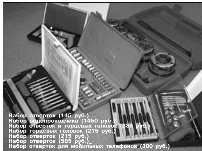
Набор отверток (145 руб.) Набор водопроводчика (1450 руб.) Набор отверток и торцевых головок (335 руб.) Набор торцевых головок (215 руб.) Набор отверток (215 руб.) Набор отверток (585 руб.) Набор отверток для мобильных телефонов (300 руб.)