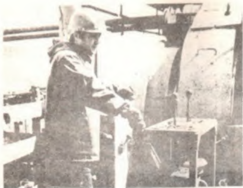
Буровщик Д. А. П. Д. П. и П. на работе.