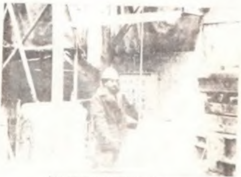
Городской комитет «САХИОН» в г. Ташкенте