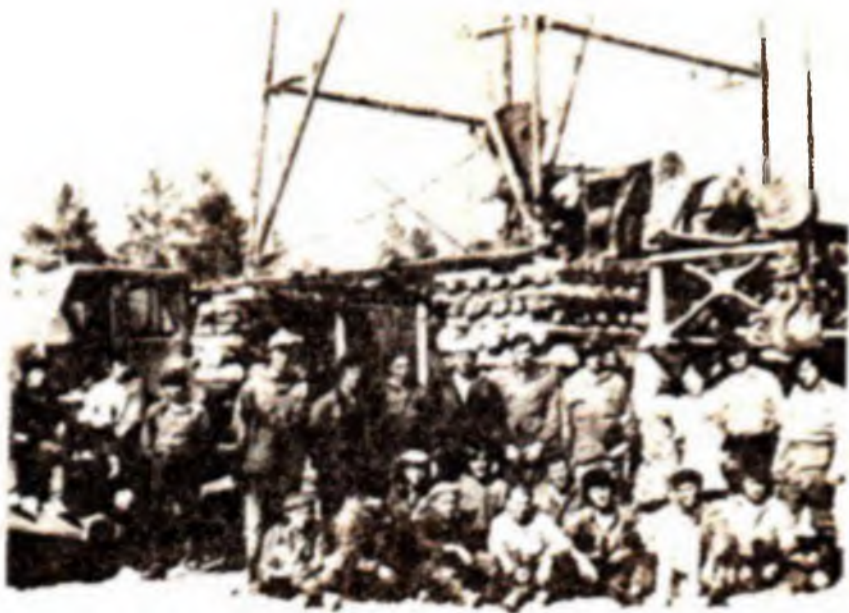
Вышкомонтажная бригада ЗМТГ-ВЗВН