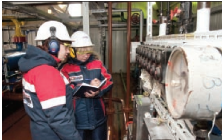
За 2011 г. в ОАО «СН-МНГ» проведено 475 аудиторских проверок

В течение 2011 года в ОАО «СН-МНГ» велась усиленная профилактическая работа, направленная на предупреждение травматизма, аварий и пожаров. Свыше 3,5 тысячи работников предприятия прошли обучение в области охраны труда, промышленной, пожарной и экологической безопасности в специальных обучающих организациях и учебных центрах.