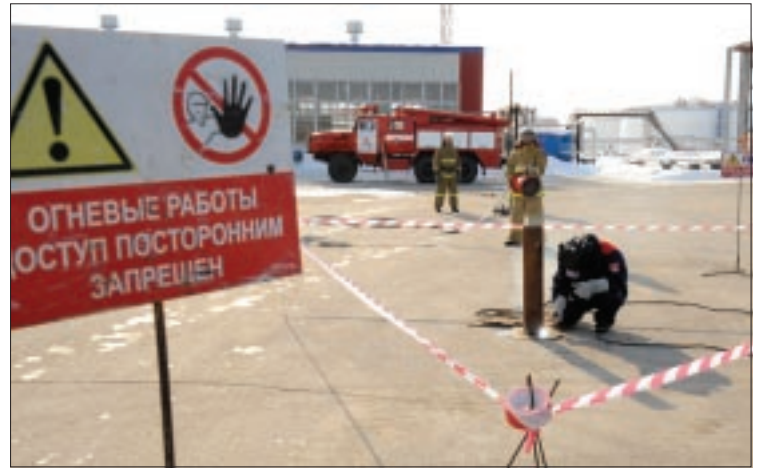
На опасном производственном объекте, как ЦППН-1 Ватинского НГДУ, дополнительные меры безопасности при проведении сварочных работ обеспечивает пожарный расчет