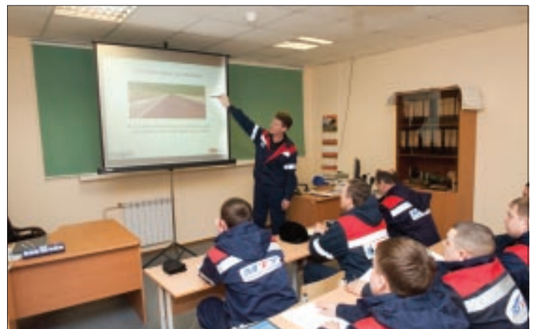
Для обучения и проверки знаний у водителей подрядных транспортных предприятий применяется многофункциональный автоматизированный комплекс. За 2011 год принято более 2,5 тысячи зачетов по ПДД

Участники совещания обсудили широкий круг вопросов: от принципов проведения инструктажей на рабочих местах до внедрения прогрессивных технологий безопасности производства. В частности, вниманию руководителей компании «Славнефть» и ее дочерних подразделений была представлена новая система автоматического пожаротушения, предназначенная