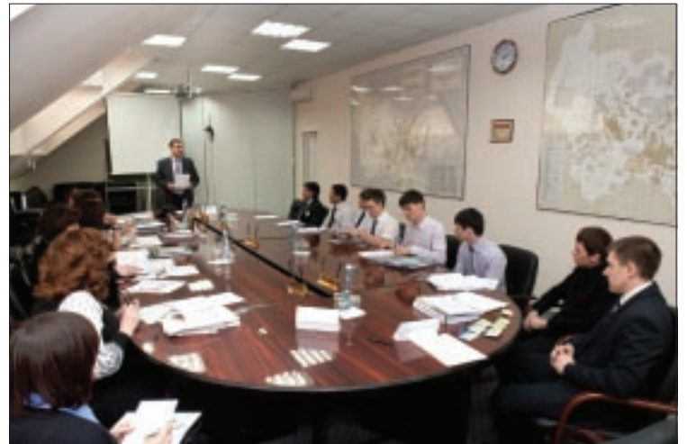
В Аганском НГДУ защищалась самая многочисленная группа стажеров