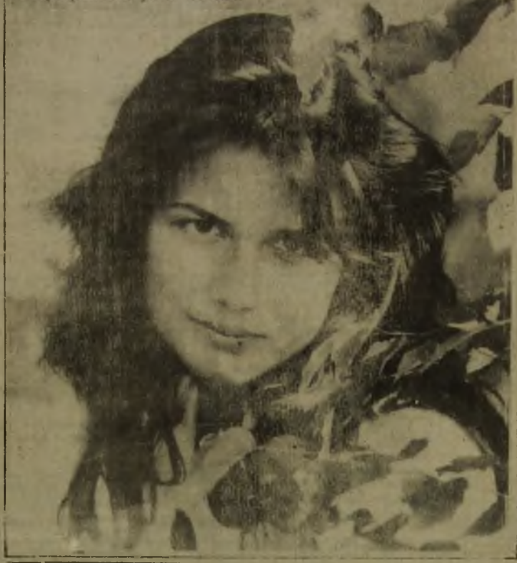
Портрет на фоне лета...

(075) Югорская инвестиционная компания, на основании доверенности № 52 от 5 августа 1993 г., выданной Фондом имущества г.Ханты-Мансийска, сообщает о проведении денежного аукциона по продаже акций АОТ СУ-12 "Строительное управление № 12", 24 августа, в 10 часов.