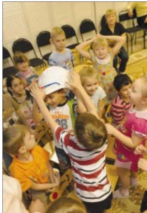
И хотя каска нефтяника этим ребятам еще велика, они уже знают, как нужен и важен труд добытчиков черного золота

о строительстве скважин, о нефтедобыче на понятном для них языке. Мне понравилось, что ребята слушали с интересом, задавали вопросы. Надеюсь, что кто-нибудь из них обязательно станет буровиком.