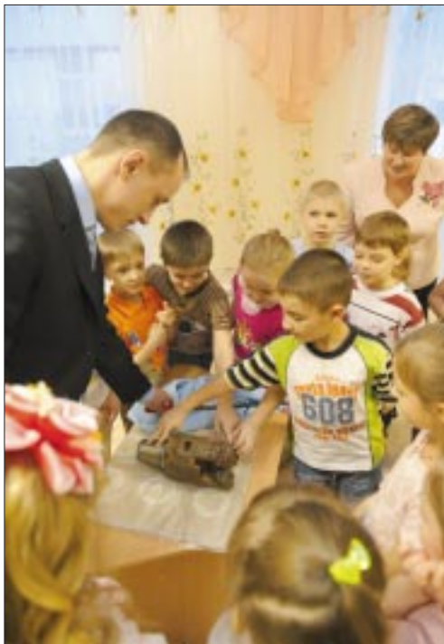
Буровой мастер не только рассказал малышам о процессе бурения скважин, но и показал, как выглядит долото – важная часть бурового оборудования

Однако сделать это было не просто, ведь на встречу собрались шестилетние малыши – подготовительная группа ДОУ «Белоснежка». Строительство скважин – сложный технологический процесс, а ребятам нужно рассказать об этом интересно и, главное, доступно.