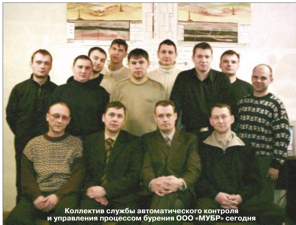
Коллектив службы автоматического контроля и управления процессом бурения ООО «МУБР» сегодня

находящийся на буровой, осуществляет управление компоновкой по заданной траектории согласно