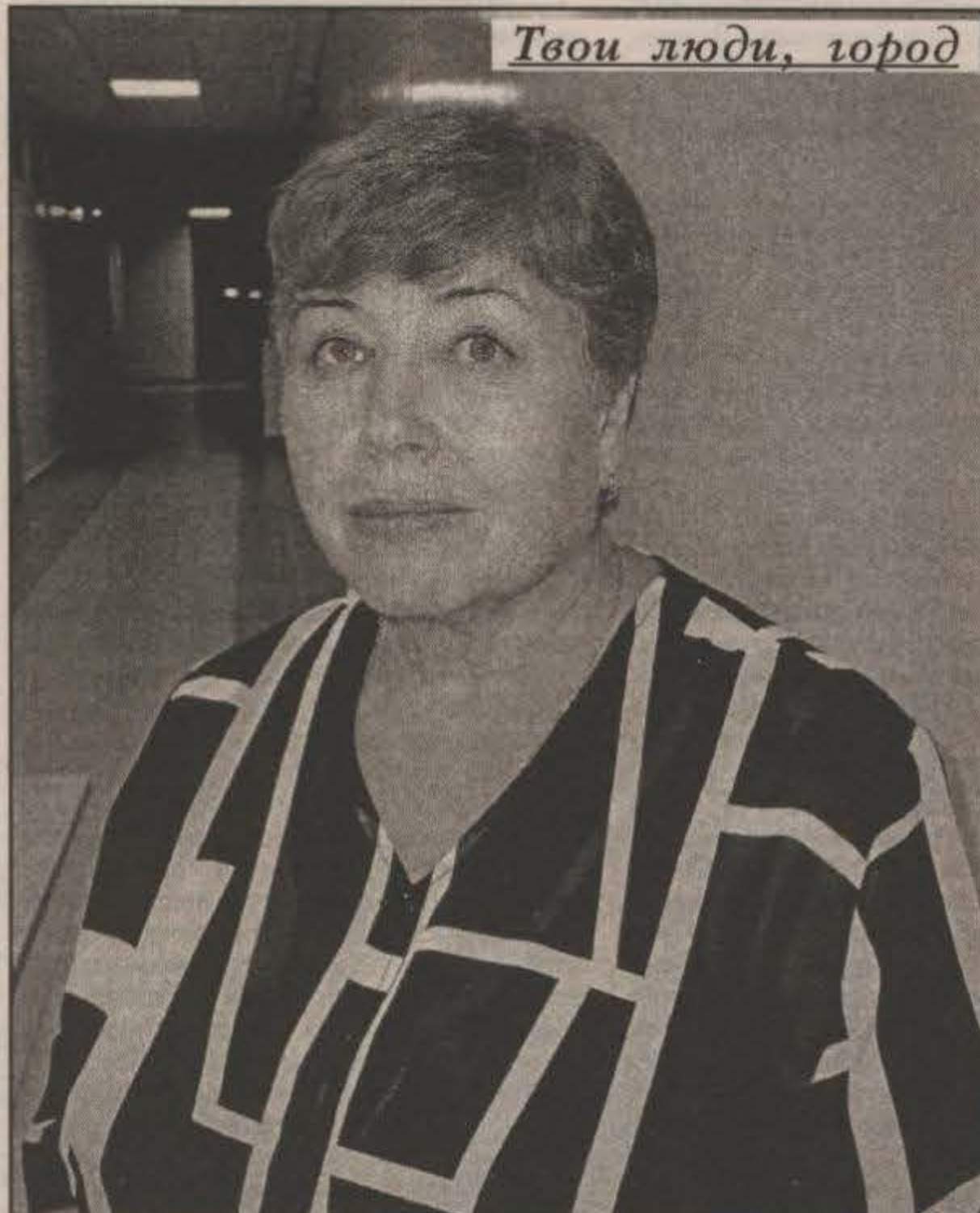
Твои люди, город