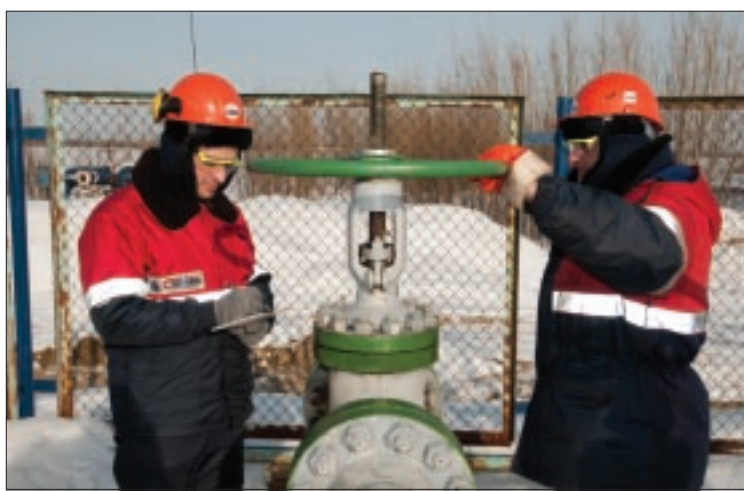
Своевременная ревизия трубопроводов и оборудования помогает предупредить аварийные ситуации

— Своей стратегической целью мы видим снижение экологичес-