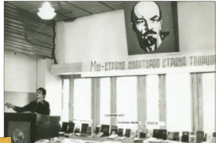
Стремление сотрудников к новаторству в работе приветствовалось и поощрялось на протяжении всей истории «Мегионнефтегаза»

дили так называемые дни специалиста, на которых инженеры знакомились с последними достижениями науки и техники и рассматривали возможности для их внедрения на предприятиях. Производственники, как и сегодня, интересовались путями повышения нефтеотдачи пластов, методы продления срока безаварийной эксплуатации оборудования, решения в сфере автоматизации производства. С годами эта работа обрела новый формат. И