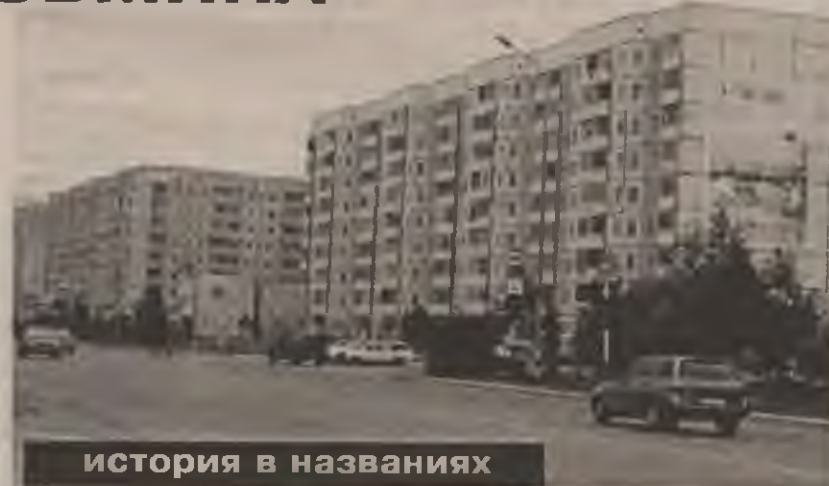
история в названиях