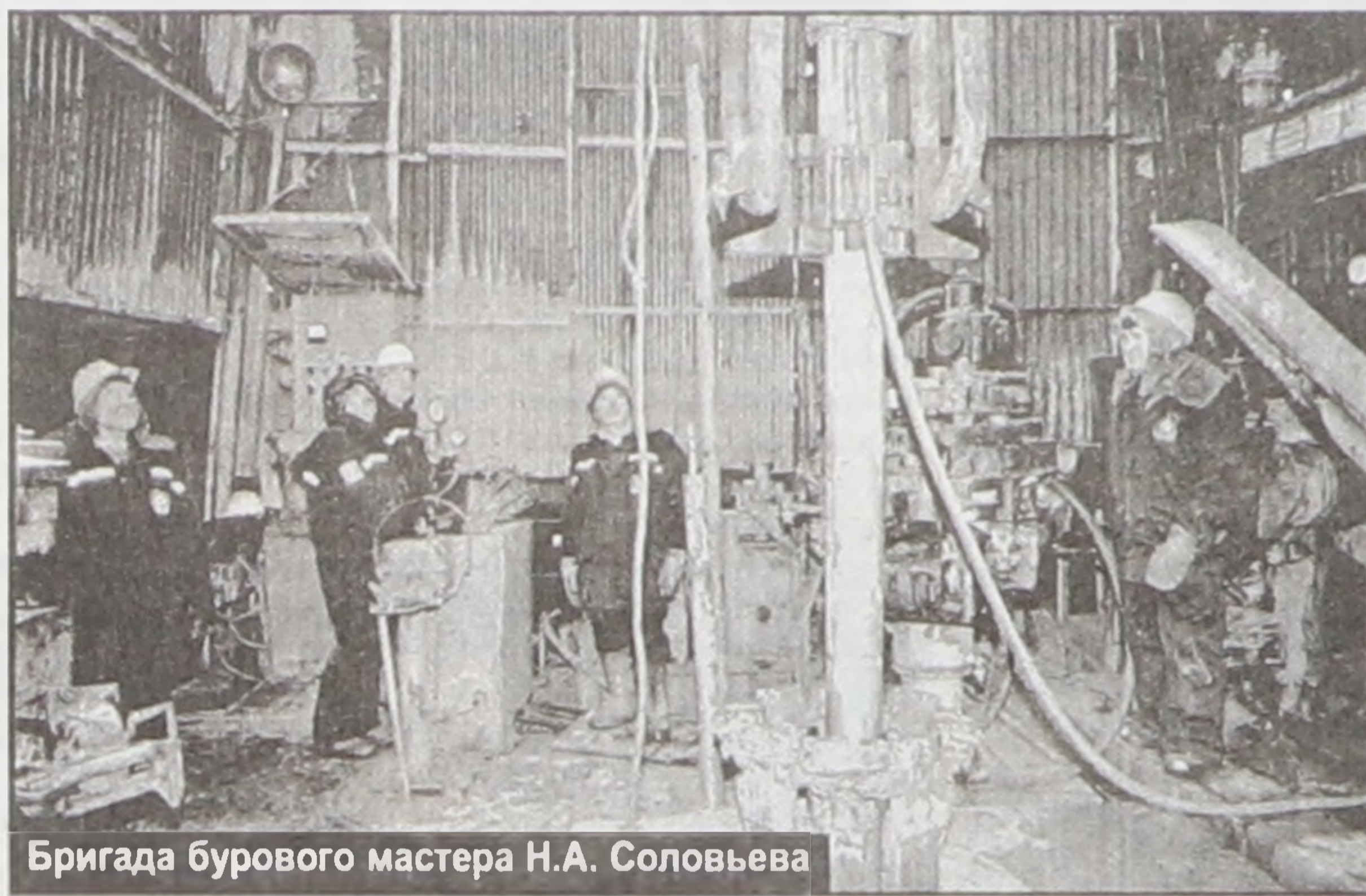
Бригада бурового мастера Н.А. Соловьева