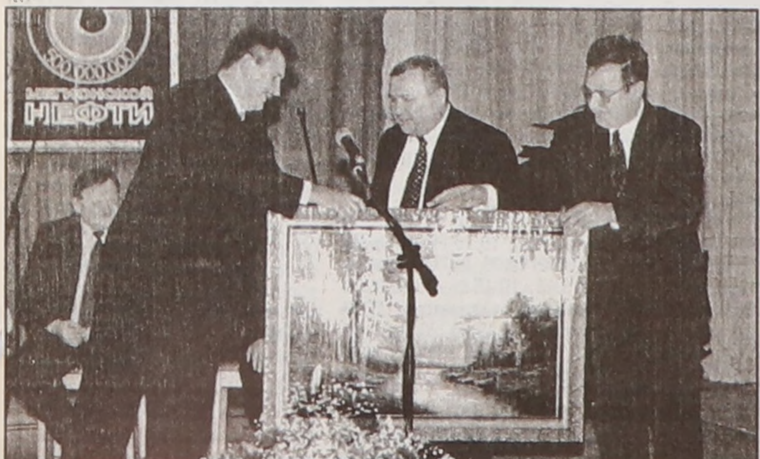
"Дарим вам золотую осень. Желтый цвет, говорят, к богатству, чего и вам желаем."