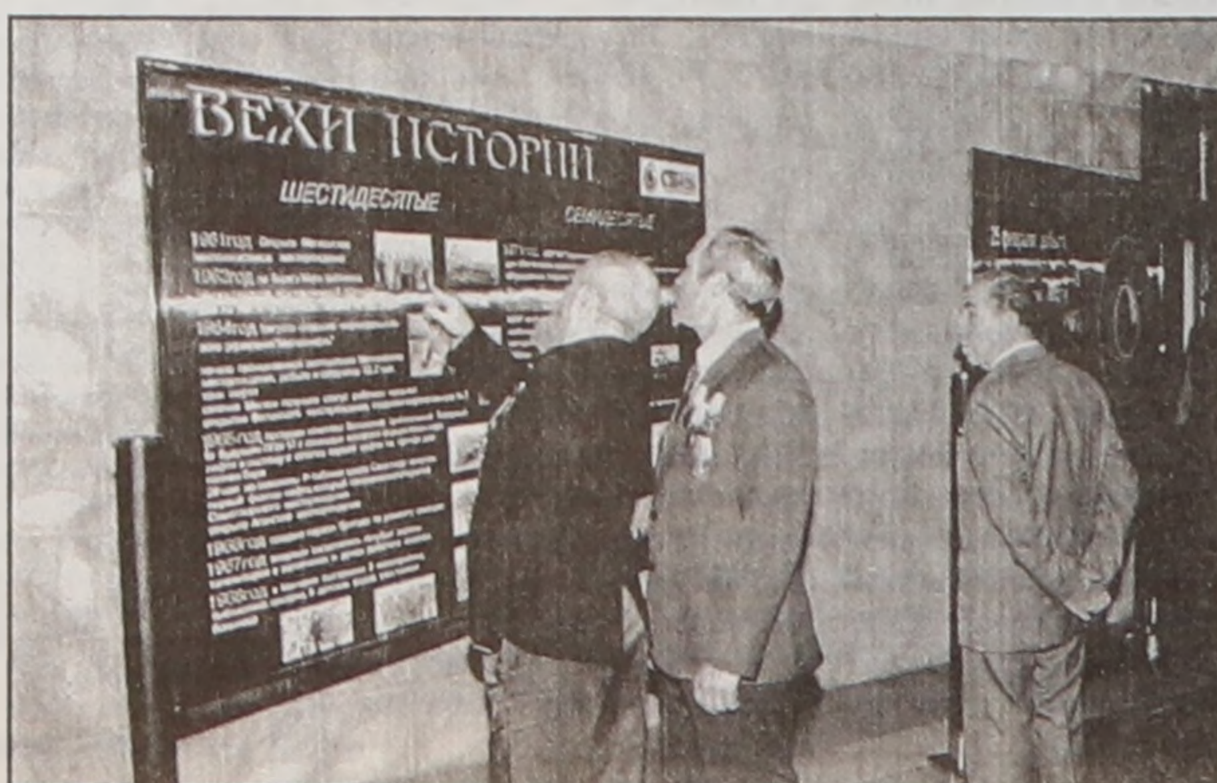
"Это наша с тобою история..."