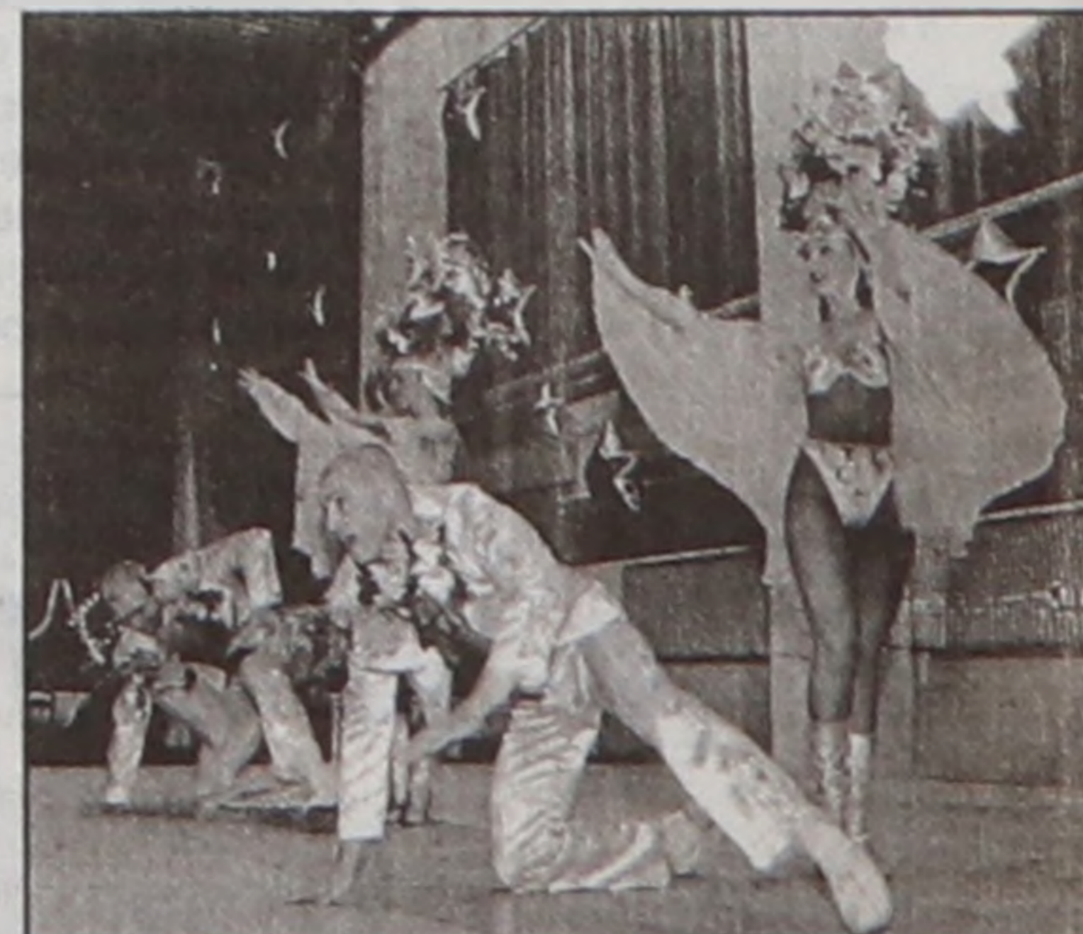
Шоу-балет "Крейзи" в очередной раз удивил собравшихся новой хореографической постановкой и оригинальными костюмами