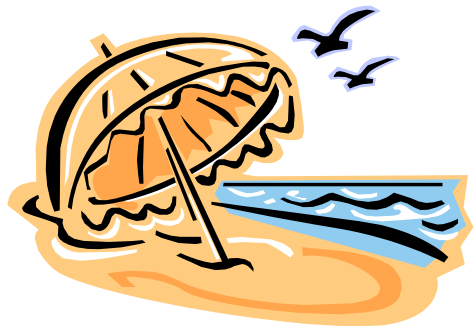
Ресурс личного и общественного развития

жет принять участие любой человек; блог; статьи о добровольчестве; видеоролики о добровольцах.