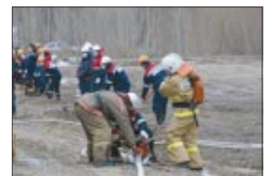
ПРОВЕРКУ ПРОШЛИ «Мегионнефтегаз» к пожароопасному периоду готов стр. 4