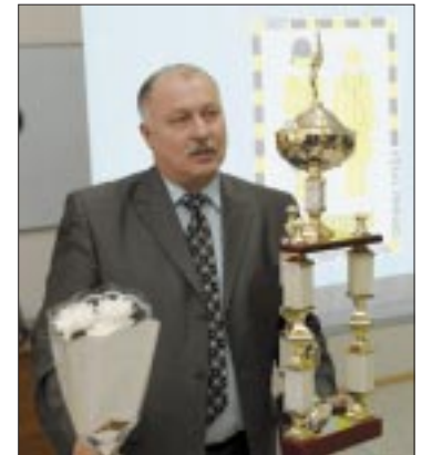
БЕЗОПАСНЫЙ ТРУД В ПОЧЕТЕ стр. 2