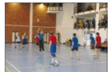
В ФИНАЛЕ – СИЛЬНЕЙШИЕ стр. 5