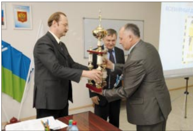
В этом году победителем смотра-конкурса по охране труда стал коллектив Ватинского НГДУ

— В прошлом году акционерное общество направило на модернизацию производства и повышение надежности оборудования свыше полутора миллиардов рублей, на мероприятия по улучшению условий труда работников — порядка 177,5 миллиона рублей, — сказал