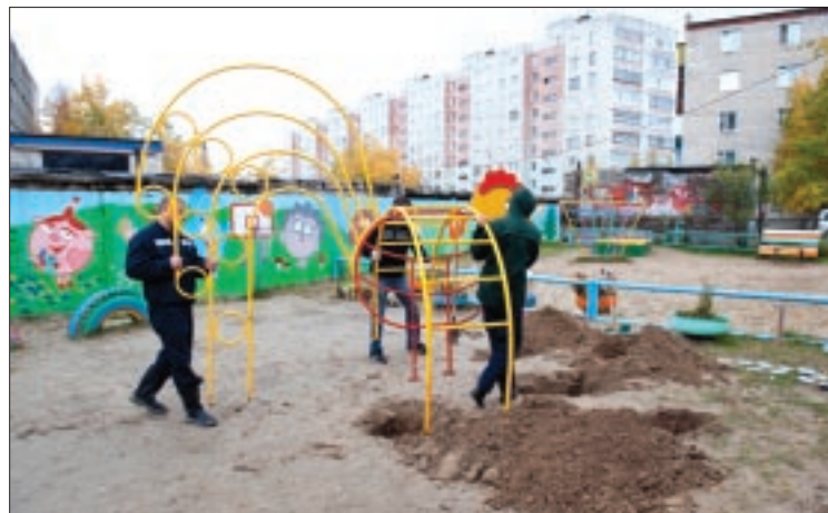
В детском саду «Улыбка» устанавливают новые игровые комплексы. Оборудование сертифицировано и соответствует нормам безопасности

дование сертифицировано, предназначено для прогулок детей от трех до семи лет и соответствует требованиям безопасности.