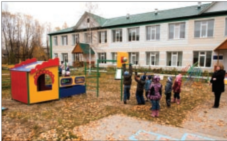
Воспитанникам детсада «Незабудка» на прогулке весело и интересно. Теперь на площадке можно найти массу увлекательных занятий

— Педагогическому коллективу очень приятно было получить такой подарок от нефтяников, — сказала Ирина Бородуля, заведующая детским садом «Улыбка». — Впервые, обновление игровых площадок произошло как раз к нашему профессиональному празднику, а во-вторых, детсаду в этом году исполняется 25 лет. Большое спасибо за новые игровые комплексы, думаю, это поможет разнообразить пребывание ребят на улице на пользу их интеллектуальному и физическому развитию. Все оборудо-