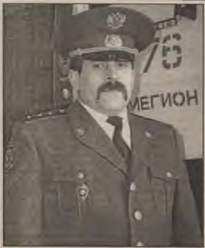
Твои люди, город

В конце периода, 1-2 мая, погода начнет меняться. Днем температура повысится от +3 до +8С. Южный ветер вновь принесет осадки. И дожди разбудят природу от зимнего сна!