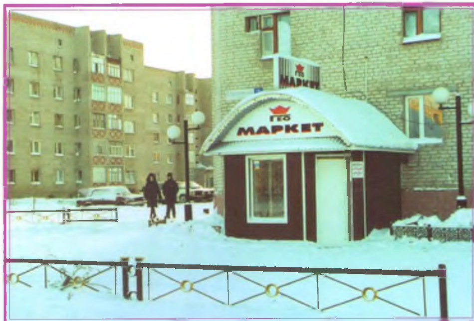
«Геомаркет» – специализированный продовольственный магазин, построенный геологами для жителей города