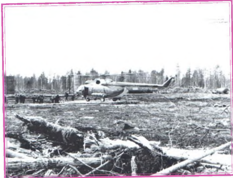
Здесь будет Аганское месторождение