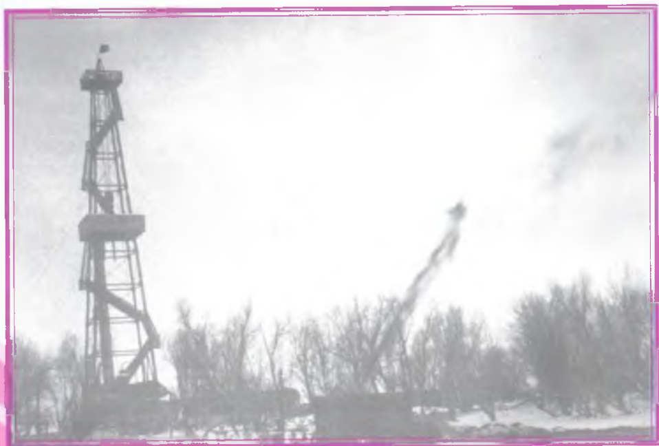
Всего за десять лет мы превратили этот таежный край в главную нефтяную базу страны