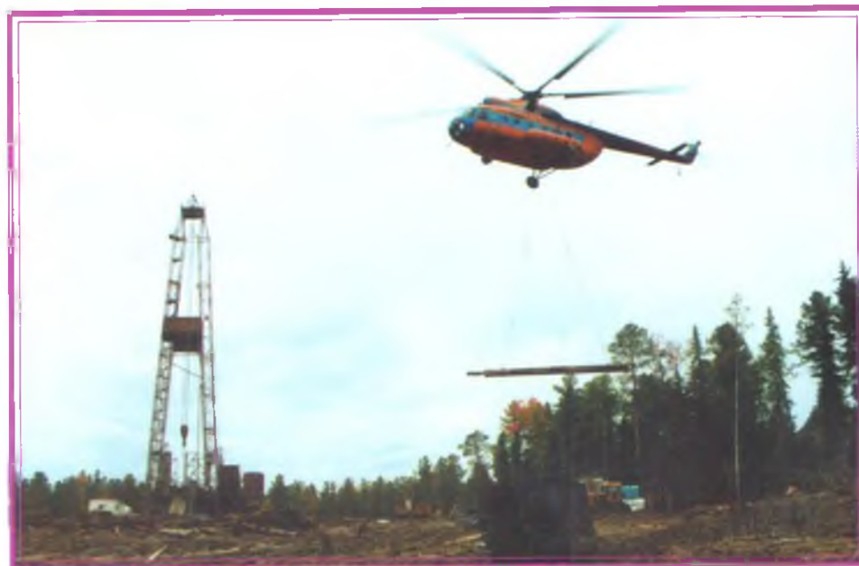
Без помощи малой авиации в геологоразведке не обойтись