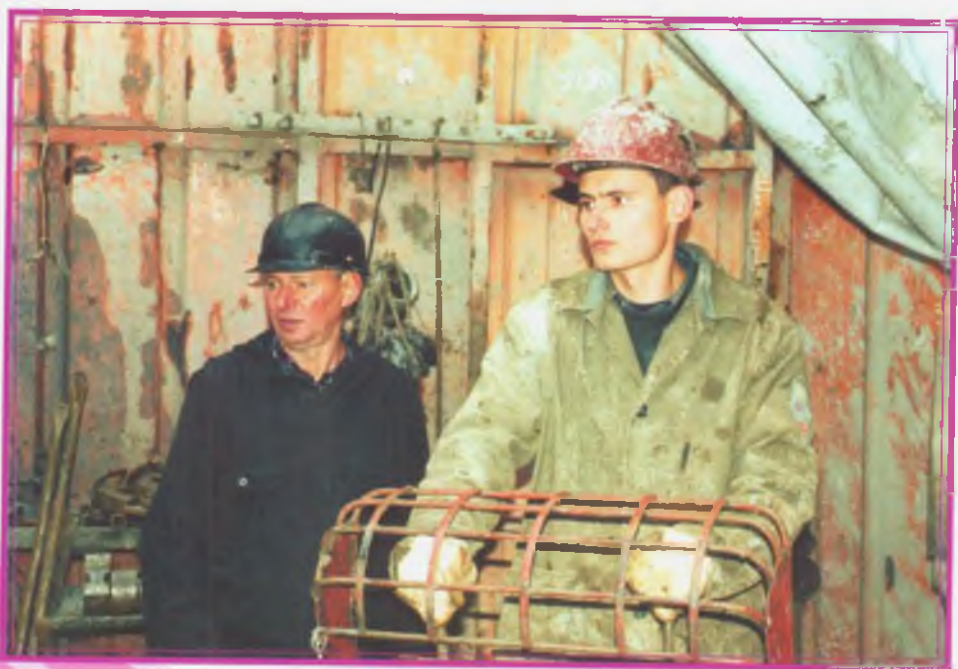
Отец и сын Литвины трудятся в одной бригаде