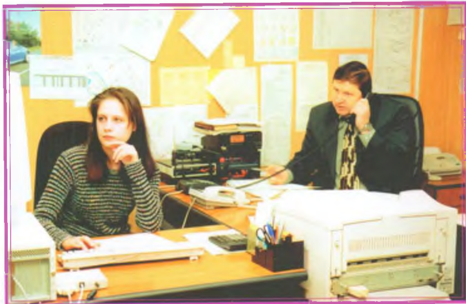
ЦДС ОАО «СН-МНГГ»: сюда стекается информация со всех структурных подразделений общества