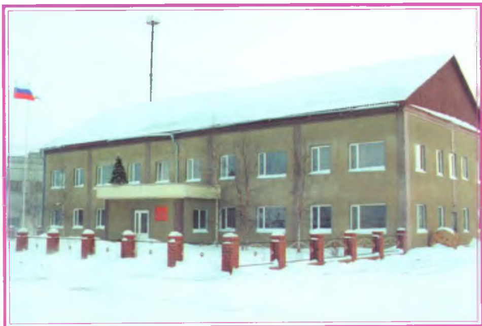
Здание МНГРЭ сегодня