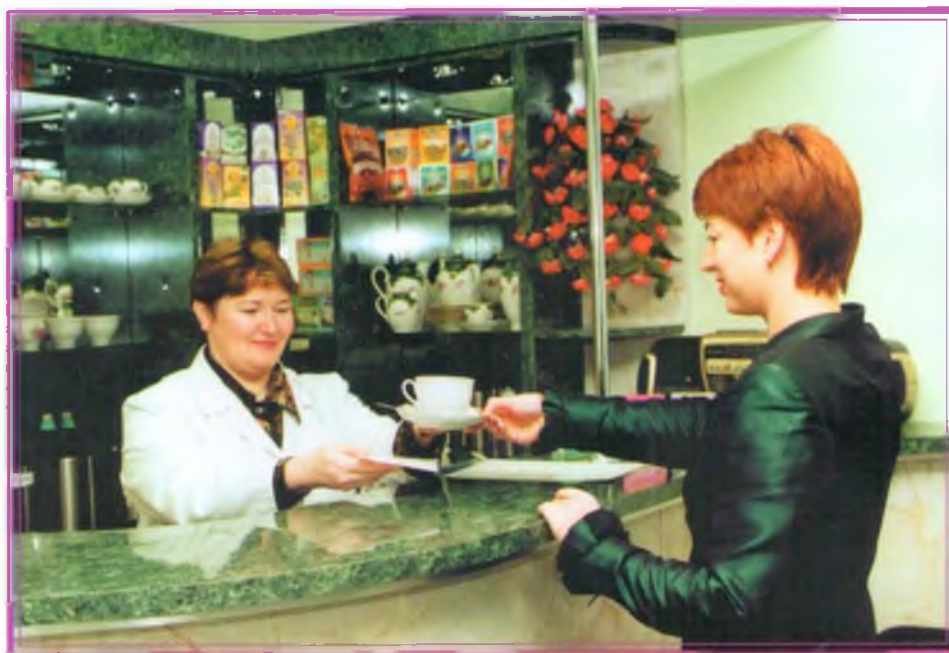
В фитобаре «Авиценны» готовят ароматный и целебный чай