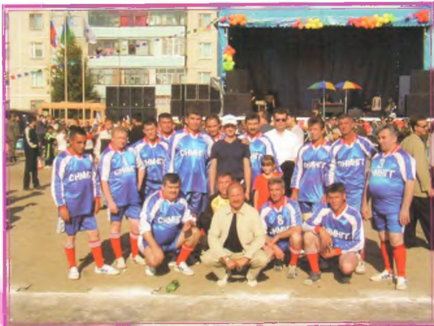
Фото на память после матча