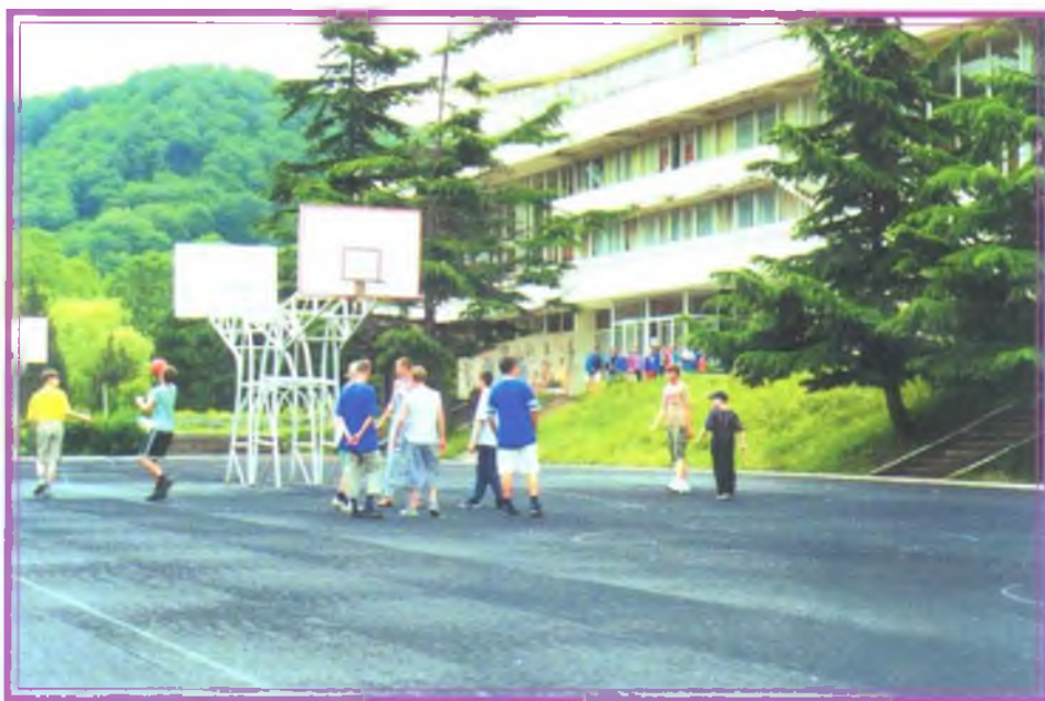
Около 100 детишек магнитских геологоразведчиков отдохнули летом 2001 года во Всероссийском детском оздоровительном центре «Орленок»