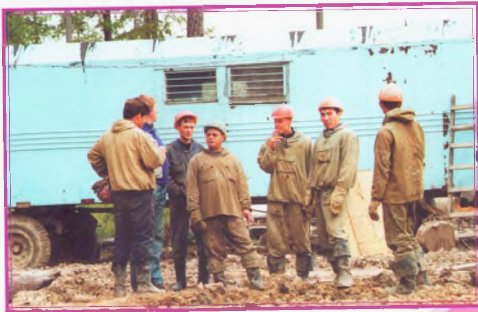
Короткие минуты отдыха