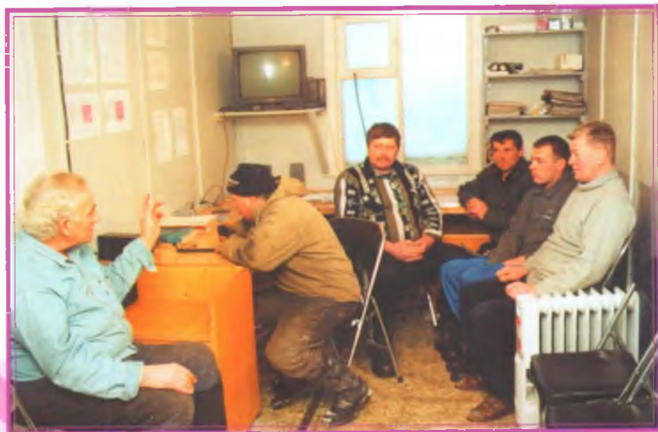
Обсуждение плана работы со свободной вахтой