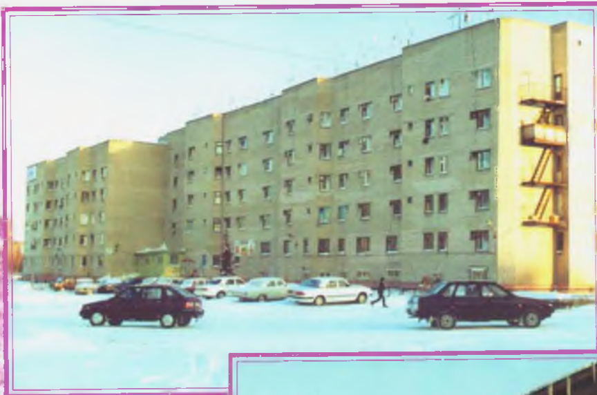
Общежитие № 5