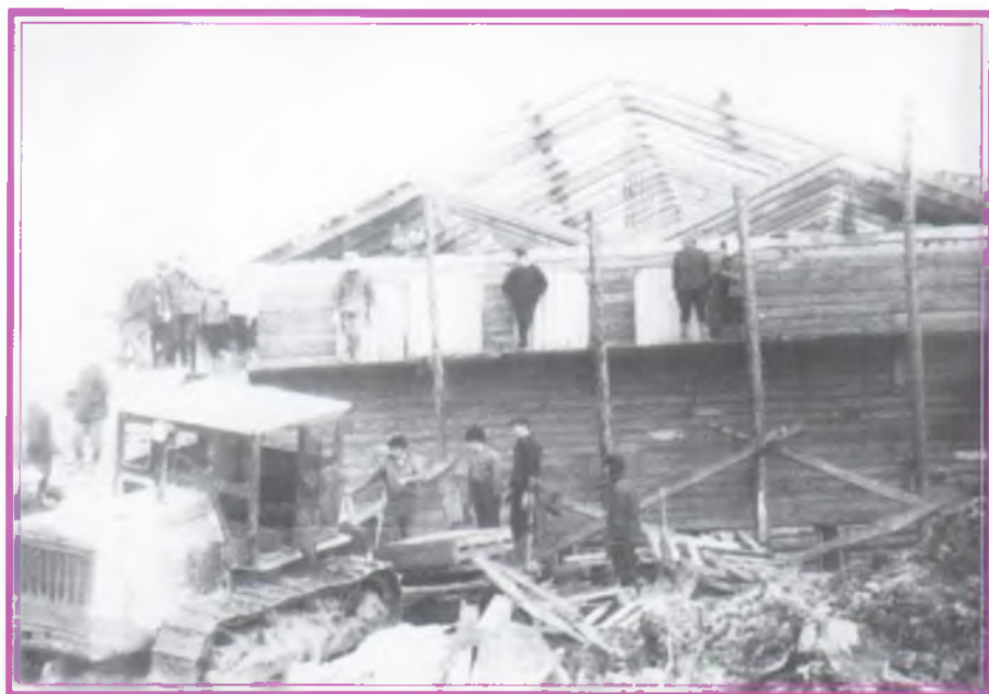
Строительство клуба «Геолог», 1965 – 1966 гг.