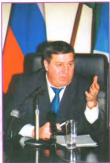
М.С.ГУЦЕРИЕВ президент АО НГК «Славнефть»