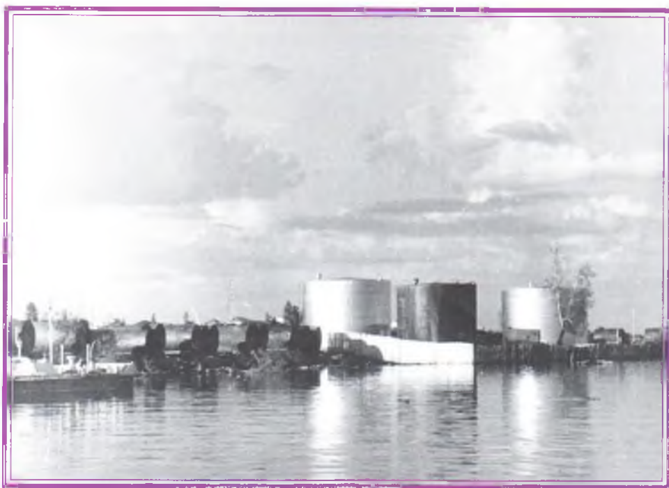
Нефтепарк. Мегион 1964 год