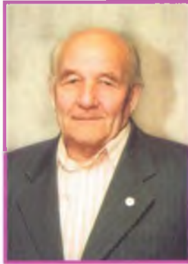
Петр Еремеевич Кравчевский