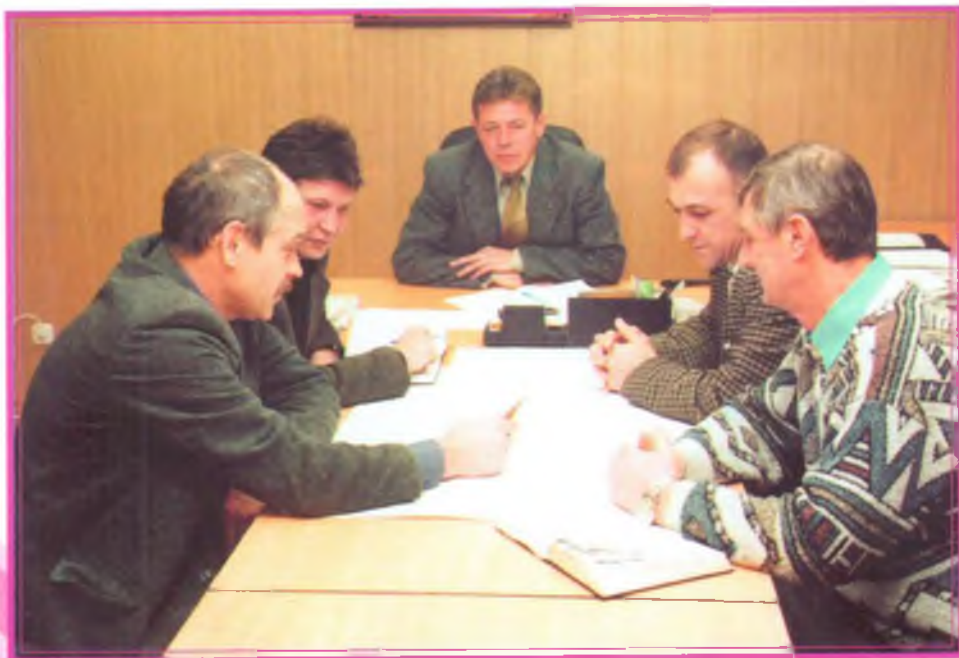
Рабочее совещание в МНГРЭ