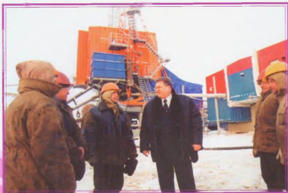
При непосредственном контакте с рабочими лучше понимаешь нужды коллектива