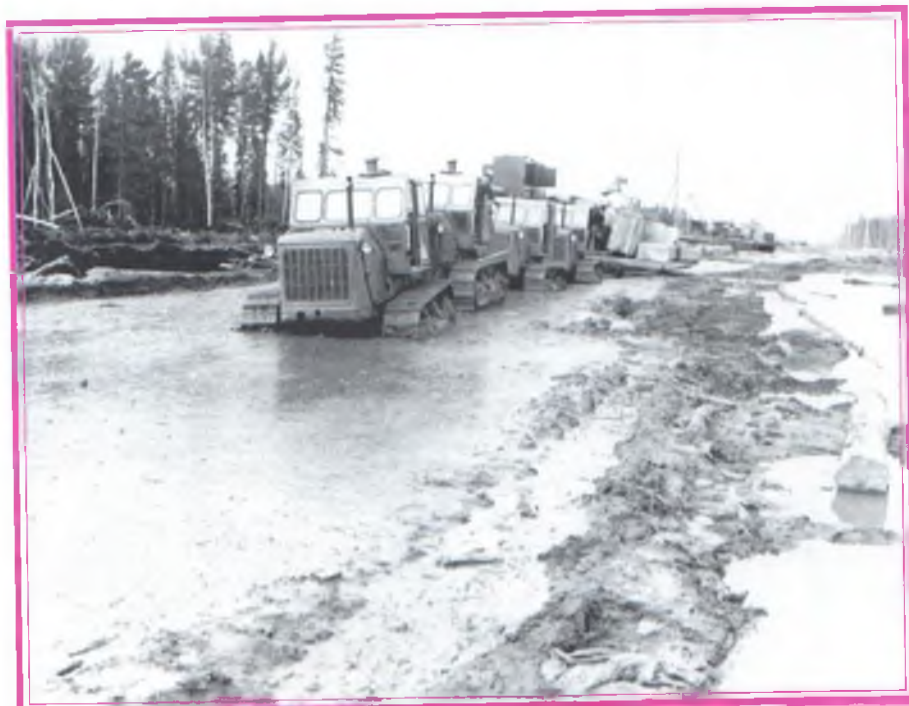
Перевозка бурового оборудования