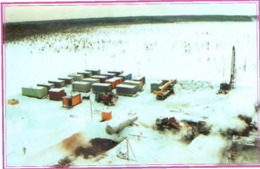
Жилой городок на разведочной скважине (Р-300) на Новопокурском месторождении