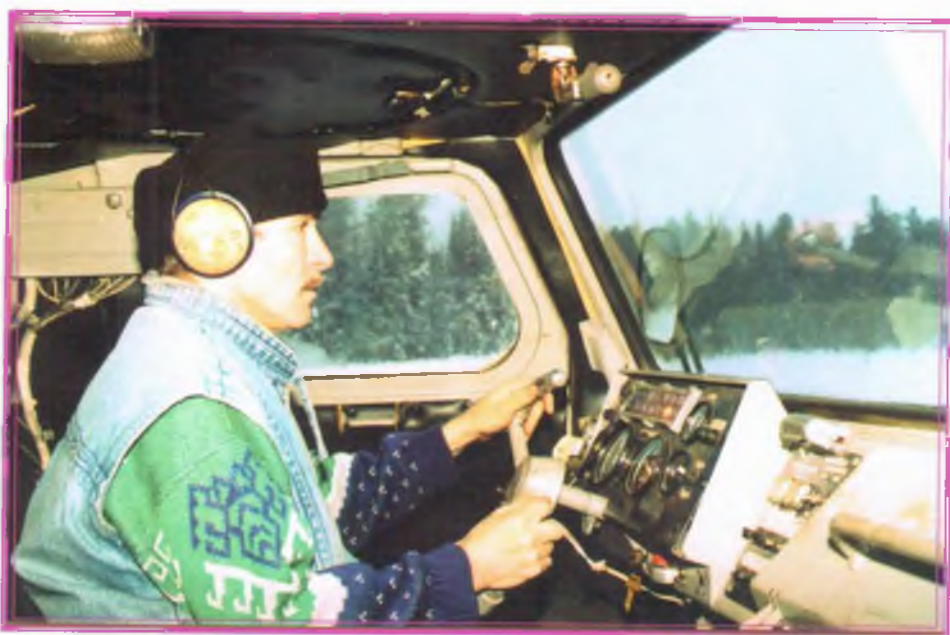
Строительство трассы под перевозку бурового оборудования на Аганском месторождении