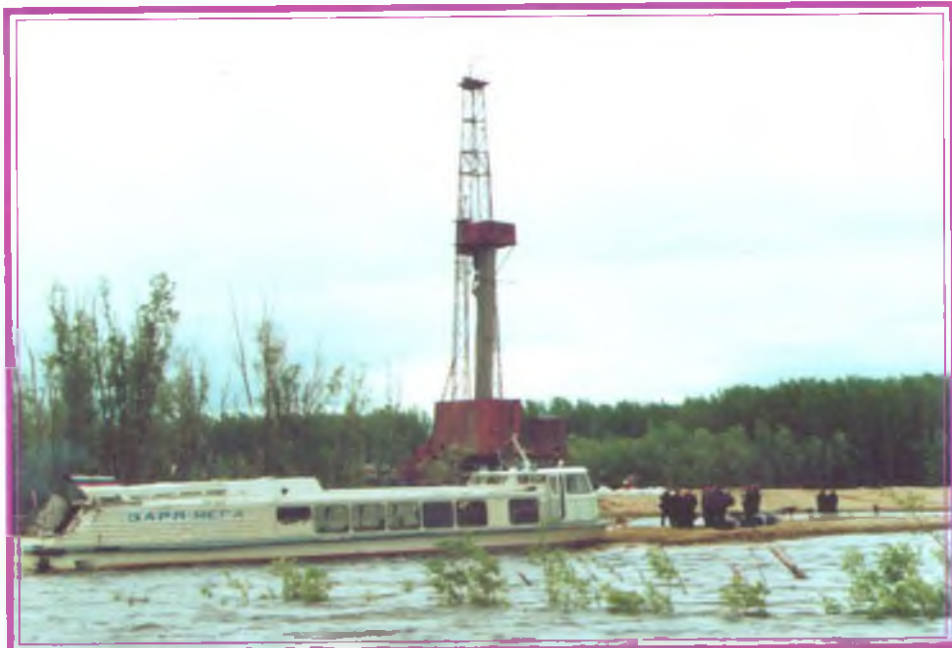
Доставка вахтовой бригады по воде