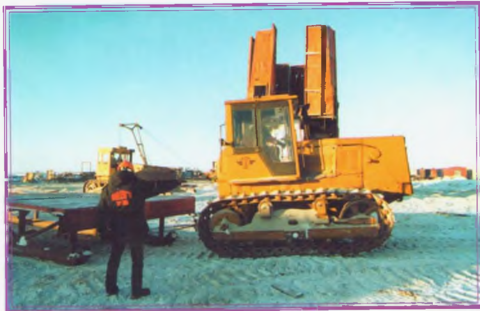
От работы вышккомонтажников зависит многое