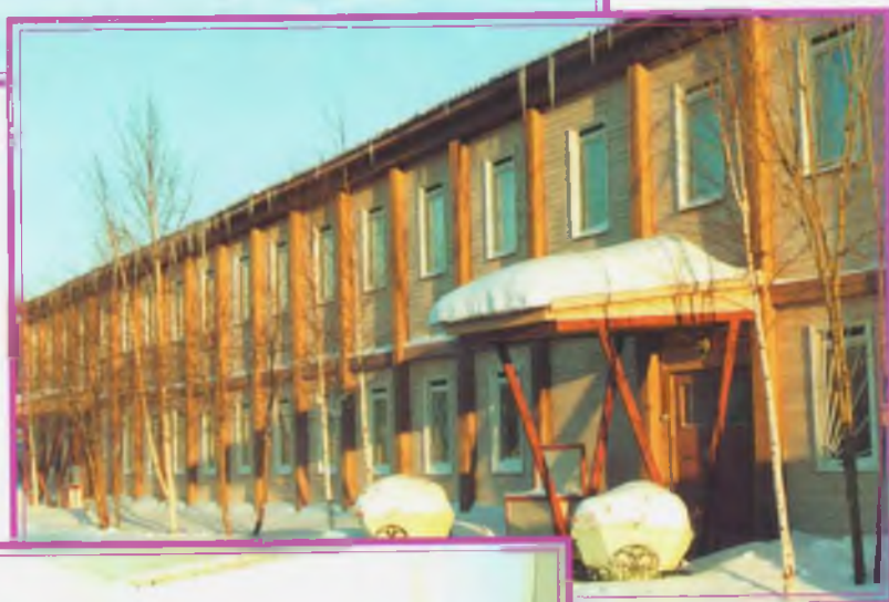
Общежитие на вертодроме «Северный»