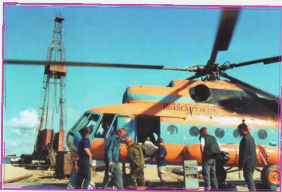
Людей, оборудование и продукты на дальние буровые можно доставить только вертолетом