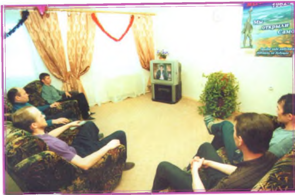
В общезитиях геологов по-домашнему уютно