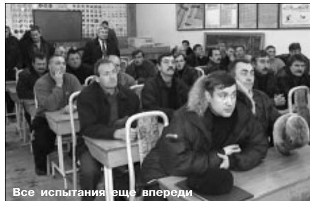
Все испытания еще впереди

На лицах присутствующих заметно волнение: первый этап конкурса – проверка правил дорожного движения. Конечно, для специалистов выполнить такое задание очень легко, но все равно каждый из участников чувствует ответственность за всю команду, ведь любая ошибка – это тридцать штрафных баллов, способные серьезно отдалить от победы.