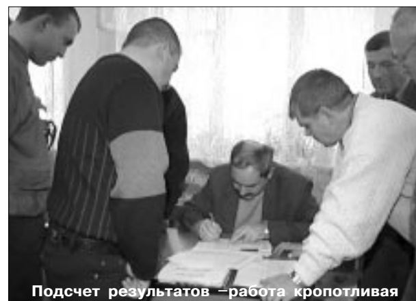
Подсчет результатов – работа кропотливая

Работа это кропотливая и, несомненно, ответственная. Поэтому на ее выполнение ушло более часа. Этот отрезок времени участникам запом-