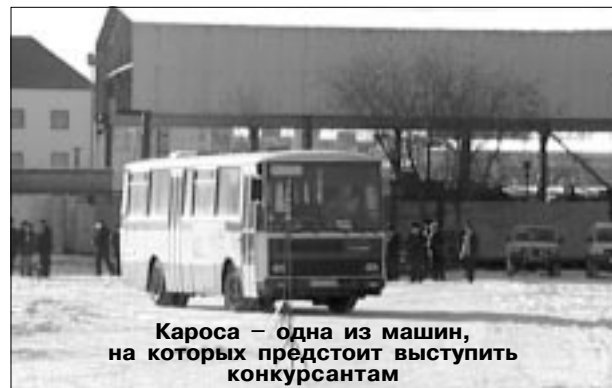
Кароса – одна из машин, на которых предстоит выступить конкурсантам

Устанавливая это требование, организаторы исходили из истины, что водитель-профессионал должен уметь управлять любой автомашиной. Конкурсанты по достоинству оценили это нововведение, считая, что теперь, когда все находится в равных условиях, соревнования стали более справедливыми, и победа достанется действительно лучшим.