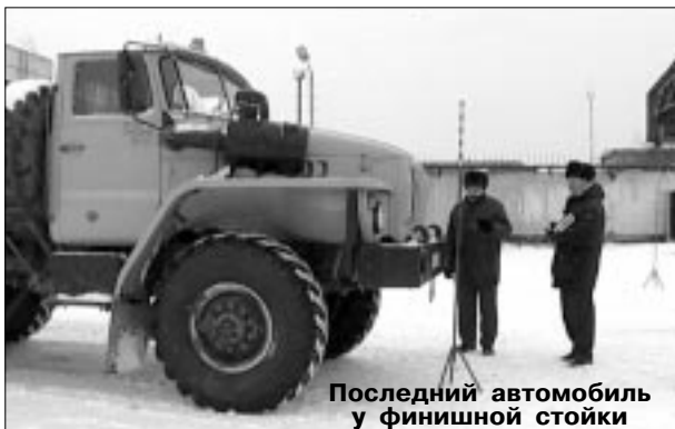
Последний автомобиль у финишной стойки