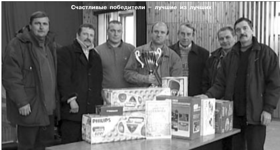
Счастливые победители – лучшие из лучших

Перед началом второй части конкурса – практического вождения была проведена жеребьевка, определившая очередность выступления команд. Все они собрались на стоянке № 2 СУТТ, где за ночь выпало