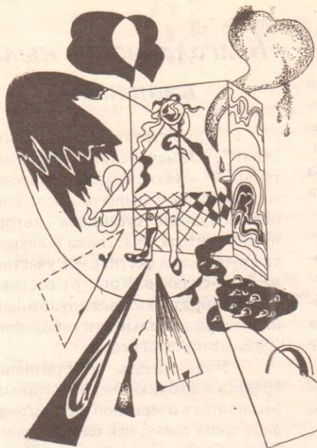
Рис. Ирины Шишкиной