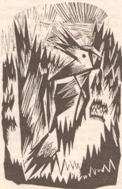
Трель Дятла. Рис. Г. Райшева

чего мучается художник”, сам Г.С. Райшев обобщил свой педагогический опыт художника. И, наконец, третья книга – это альбом ранее не экспонировавшихся полотен “Геннадий Райшев. Живопись, графика”.