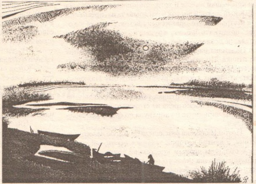
Рис. А. Мухаметовой

-Вот, собирай, - сказал папа. – Сможешь собрать все?