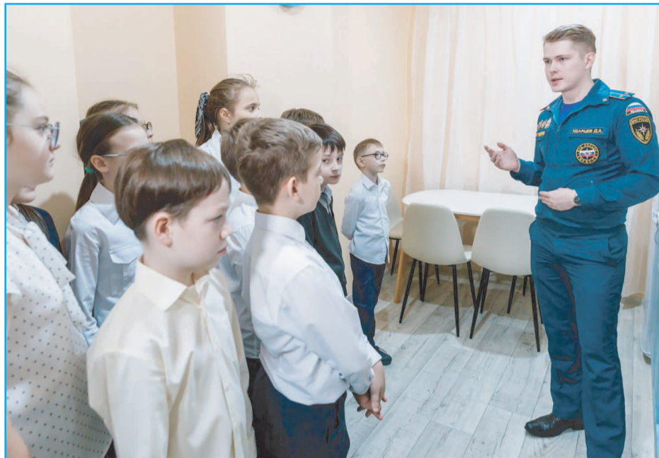
В мегионской школе № 1 им. Г. И. Норкина появилась... однокомнатная квартира. Именно в таком формате сделан первый в городе кабинет безопасности. Уникальный класс создан при финансовой поддержке "Славнефть-Мегионнефтегаза". Здесь ребят будут учить правильно себя вести в чрезвычайных ситуациях (ЧС).

Сотрудники МЧС провели первое тренировочное занятие с детьми. Школьники оказались достаточно теоретически "подкованными". Без подсказок назвали номера телефонов экстренных служб. А на вопрос "Как надо сообщать о пожаре?" хором отвечали: "Что горит, где горит, кто говорит".