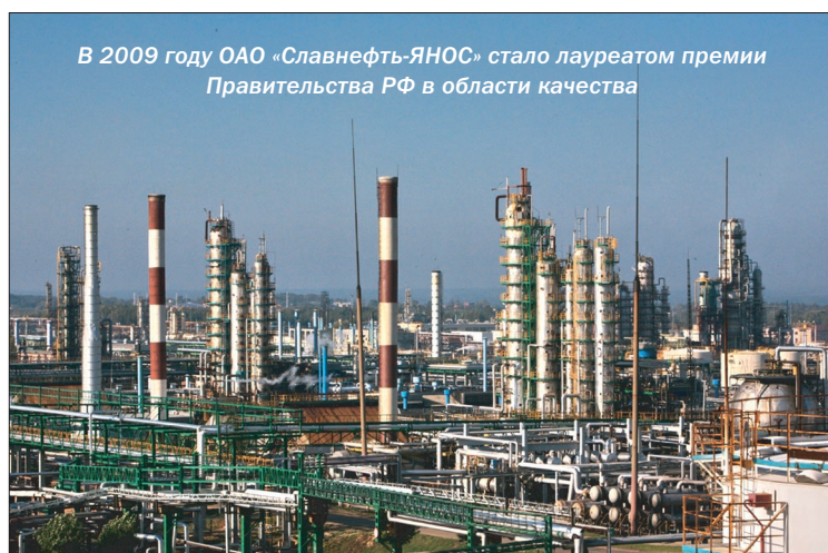
В 2009 году ОАО «Славнефть-ЯНОС» стало лауреатом премии Правительства РФ в области качества

По материалам информационного агентства «ИНТЕРФАКС».