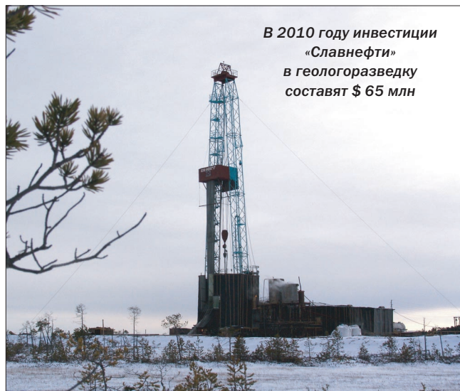
В 2010 году инвестиции «Славнефти» в геологоразведку составят $ 65 млн

Президент «Славнефти» также сообщил, что в течение 2009 года компания продолжала активную работу по совершенствованию корпоративных процедур и повышению уровня информационной открытости. «Мы стремимся перенимать передовой опыт, ориентируясь на международные стандарты корпоративного управления и прозрачности, внедряем