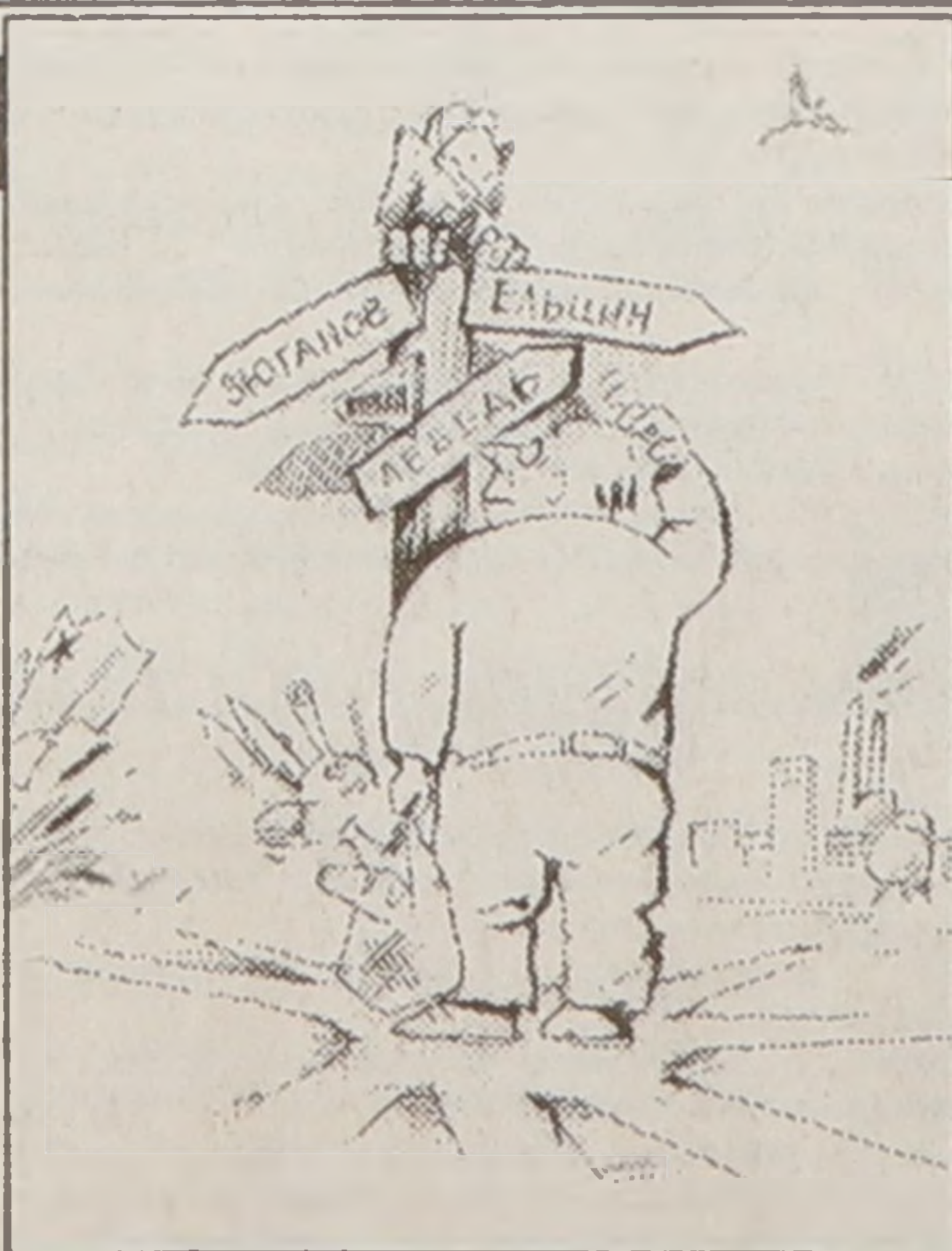
Рис. Альберта Вахитова

Социологическая лаборатория школы-гимназия №5