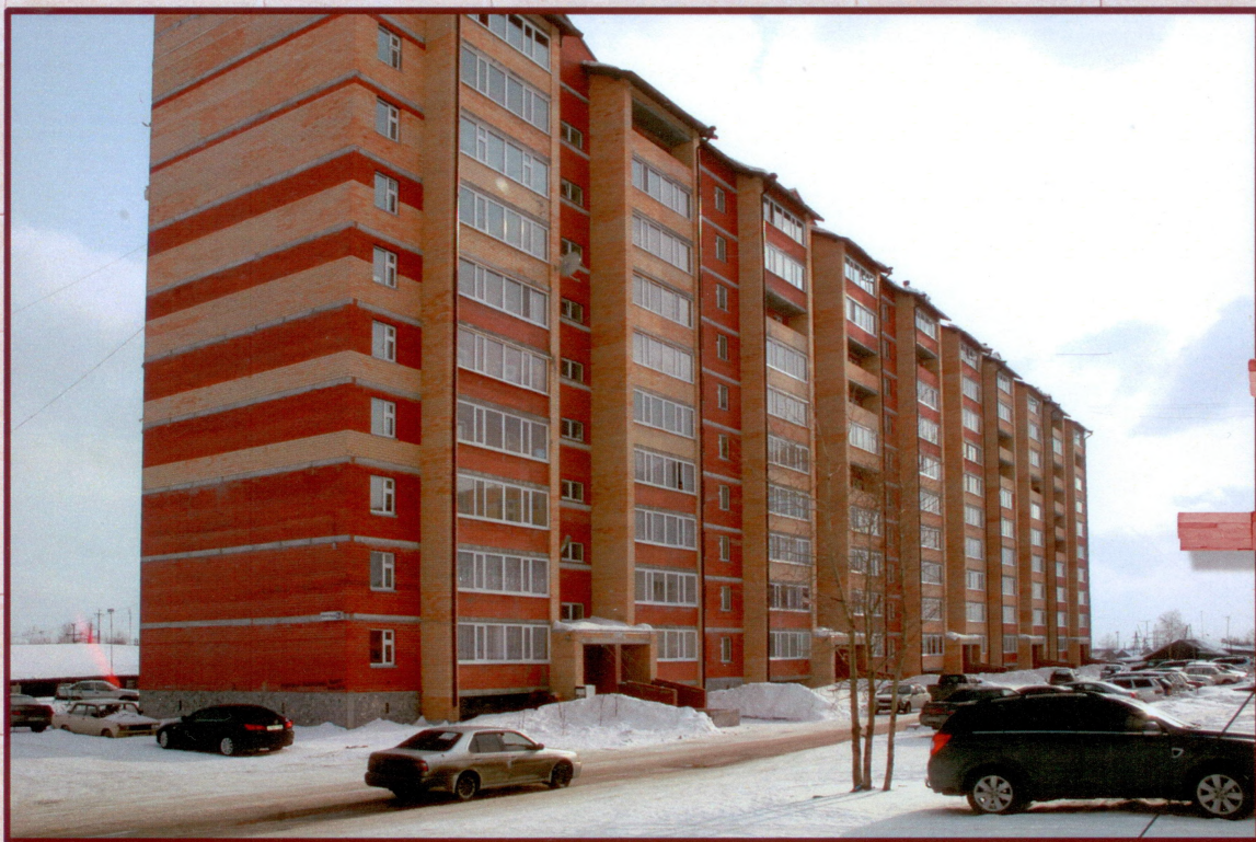
10-ти этажный 178-ми квартирный жилой дом г. Мегион, Пр. Победы, д. 9/1 Сдан 28.12.2006 г.