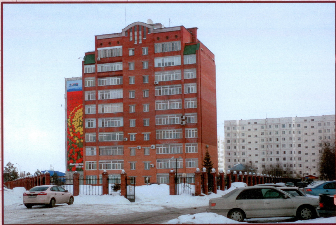
Жилой дом № 3 в 6 мкр. г. Мегион, ул. Кузьмина, д. 30 Сдан 01.12.2000 г.