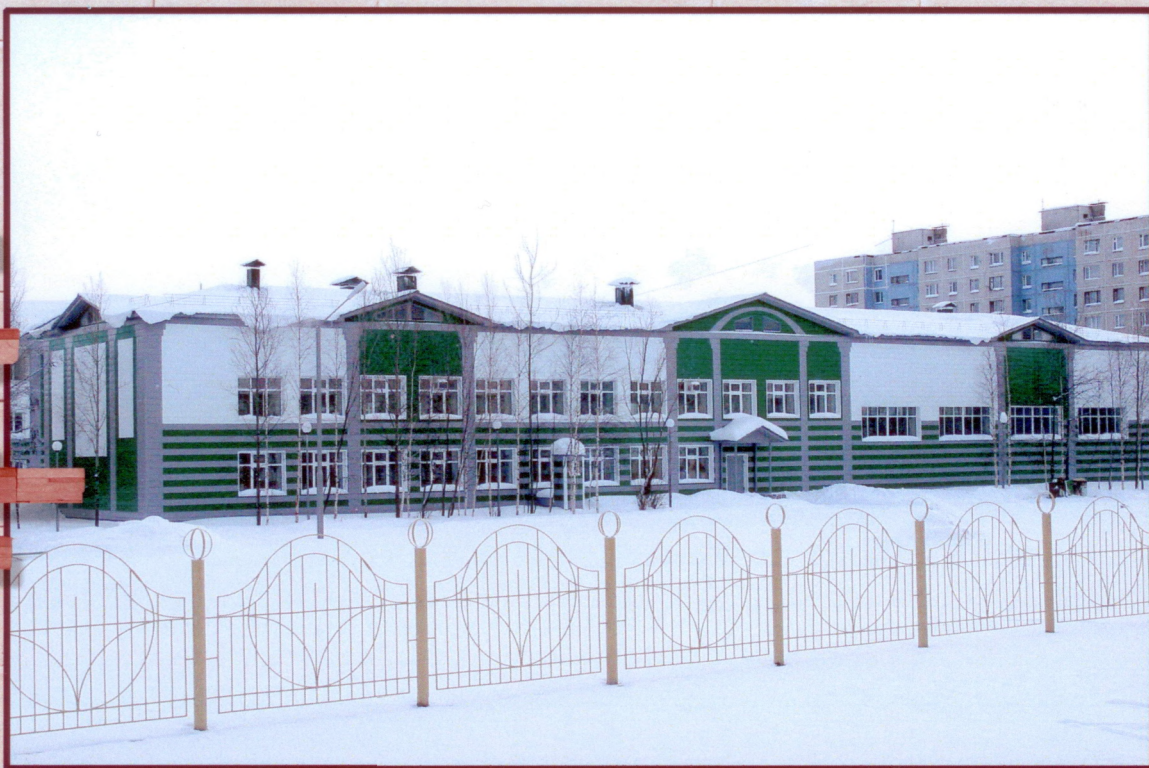
Ремонт МОУ СОШ №3 г. Мегион, ул. Нефтяников Сдана 01.11.2004 г.