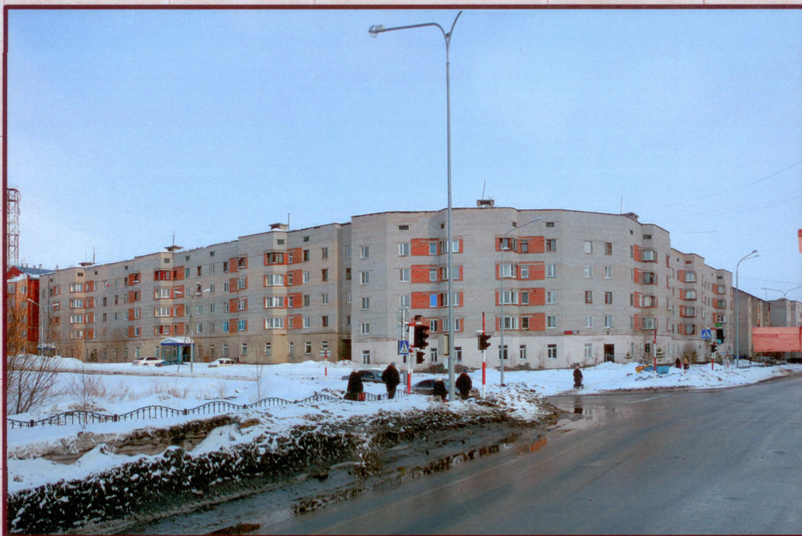
ОПК и ХОСПиС г. Мегион, Проспект Победы, д. 14 Сдан 20.12.2001 г.