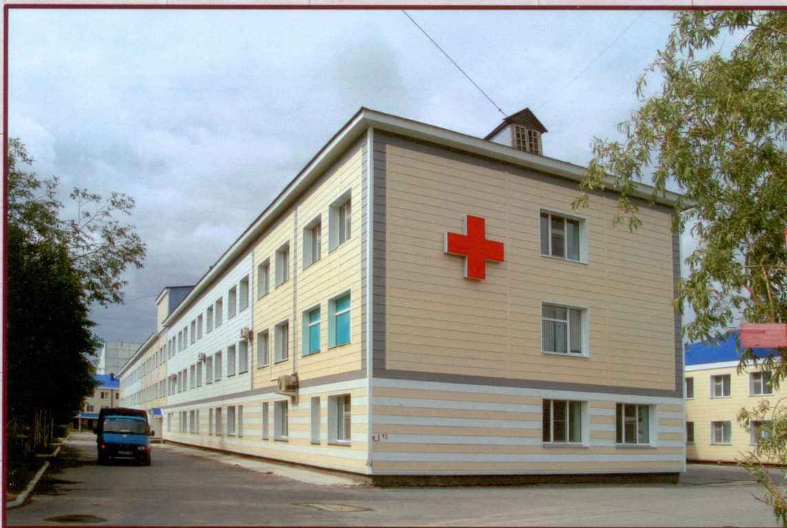
Капитальный ремонт хирургии г. Мегион, ул. Заречная Сдана 01.07.2003 г.