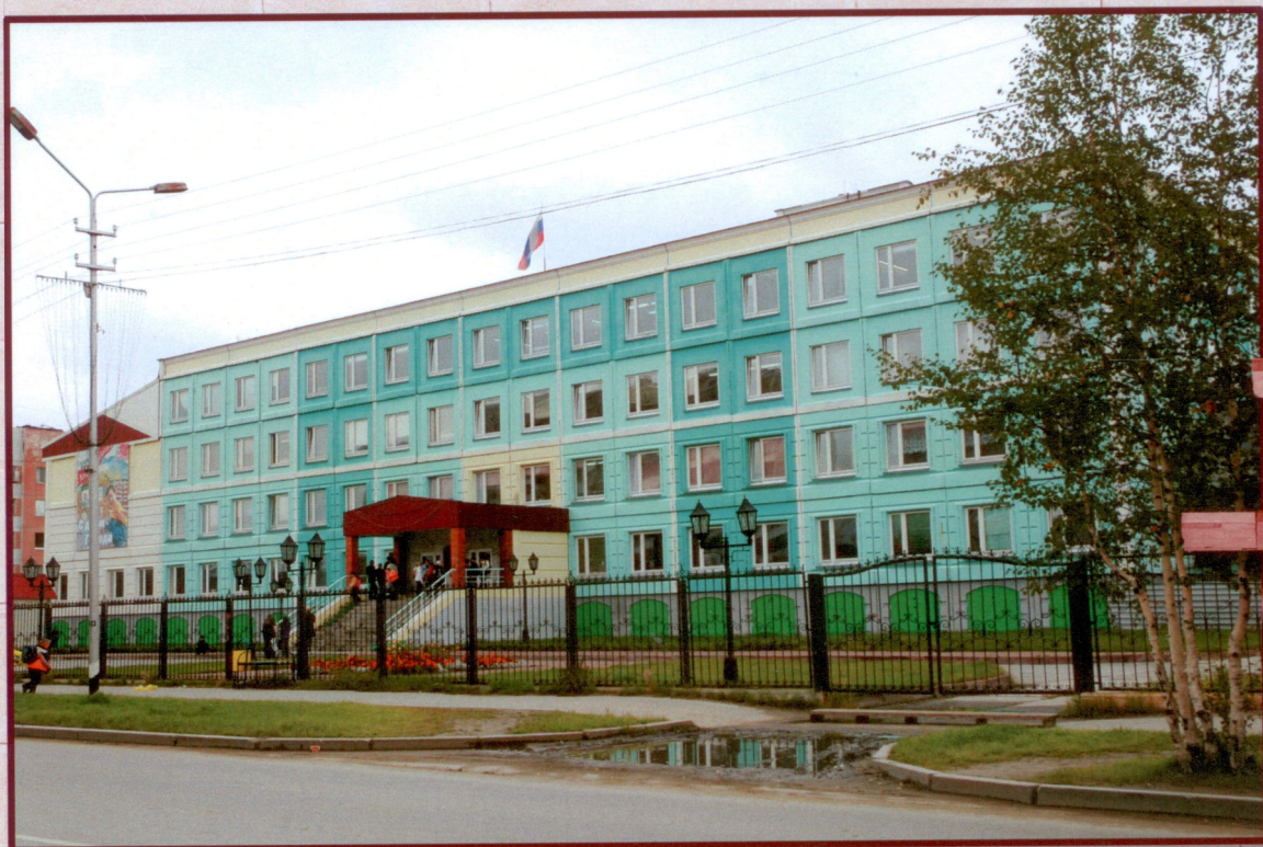
Школа на 36 классов в 9 мкр. Сдана 30.08.2000 г.