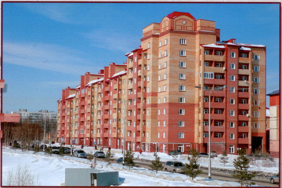
6-9-ти этажный жилой дом с магазинами в 1 этаже г. Мегион, ул. Заречная Сдан 29.12.2009 г.

МБУ «Централизованная библиотечная система» Инд. № 86788/1-11