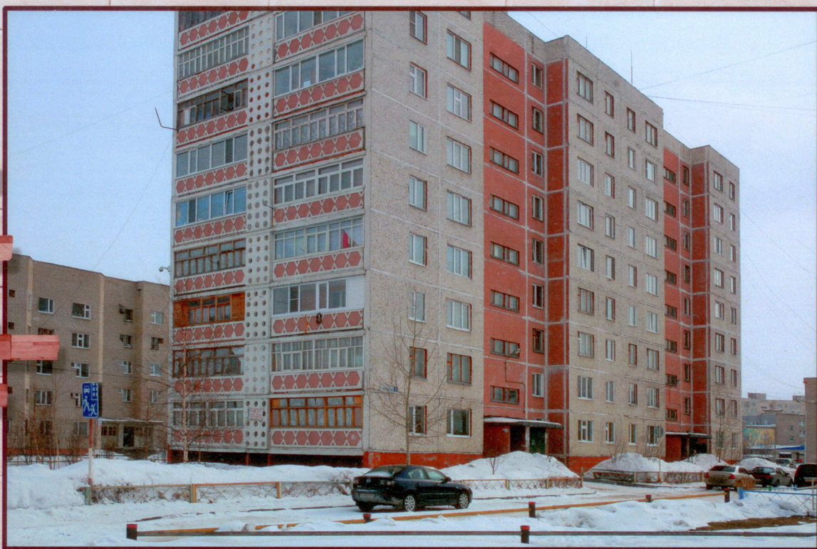
72 кв. жилой дом № 1 в 14 мкр. (АСБ) г. Мегион, ул. Геологов, д. 1 Сдан 26.06.1997 г.