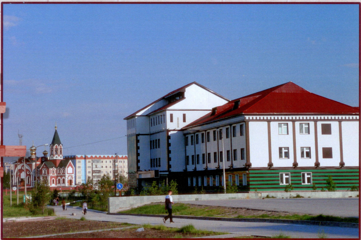
МЛПУ “Городская больница” г. Мегион, ул. Заречная Сдана 11.01.2000 г.