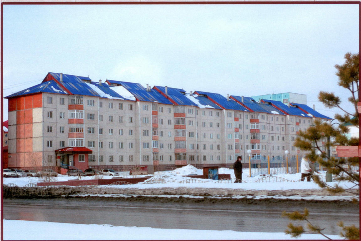
Жилой дом № 5 в 7 мкр. г. Мегион, ул. Заречная, д. 1 Сдан 25.02.2000 г.