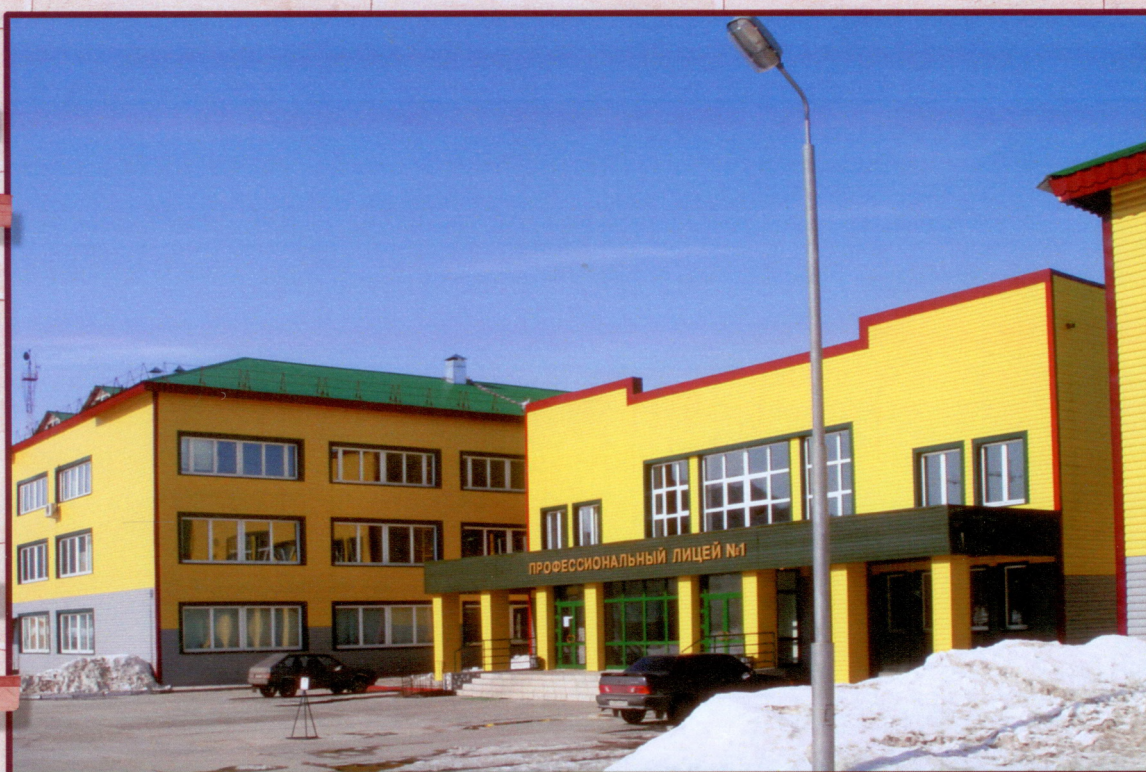
ПТУ на 500 учащихся (Блок А1, КНС) г. Мегион, ул. Кузьмина Сдано 30.12.2002 г.