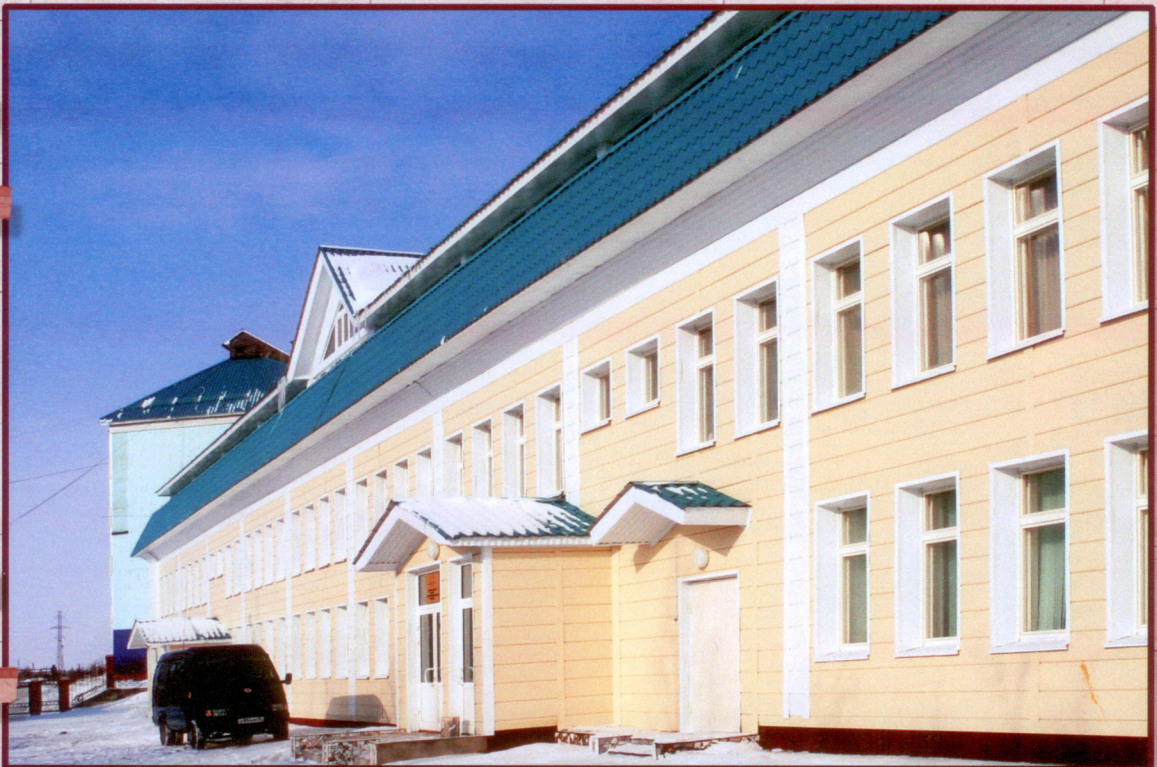
Реконструкция здания поликлиники под психонаркологическое отделение г. Мегион, ул. Садовая, д. 3 Сдано 28.02.2004 г.