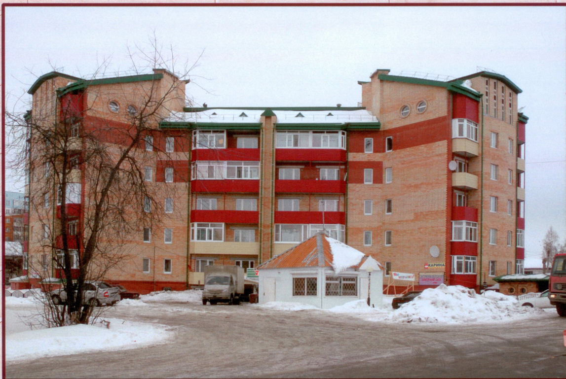
5 эт. 60-ти квартирный жилой дом в 11 мкр. г. Мегион, ул. Советская Сдан 29.11.2007 г.