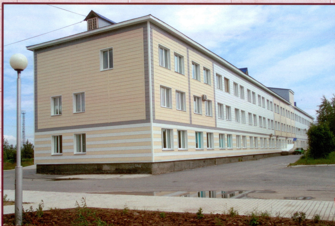
Капитальный ремонт хирургии г. Мегион, ул. Заречная Сдана 01.07.2003 г.