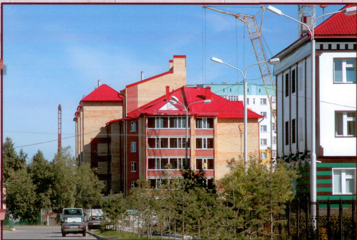
66-ти квартирный жилой дом в 7 мкр. г. Мегион, ул. Чехова, д. 1 Сдан 15.11.2006 г.