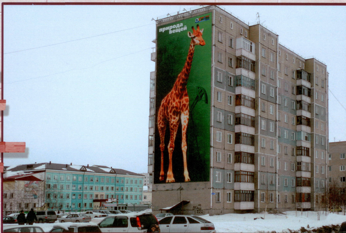
98 кв. жилой дом № 5 в 8 мкр. г. Мегион, ул. 50 лет Октября Сдан 01.02.2000 г.