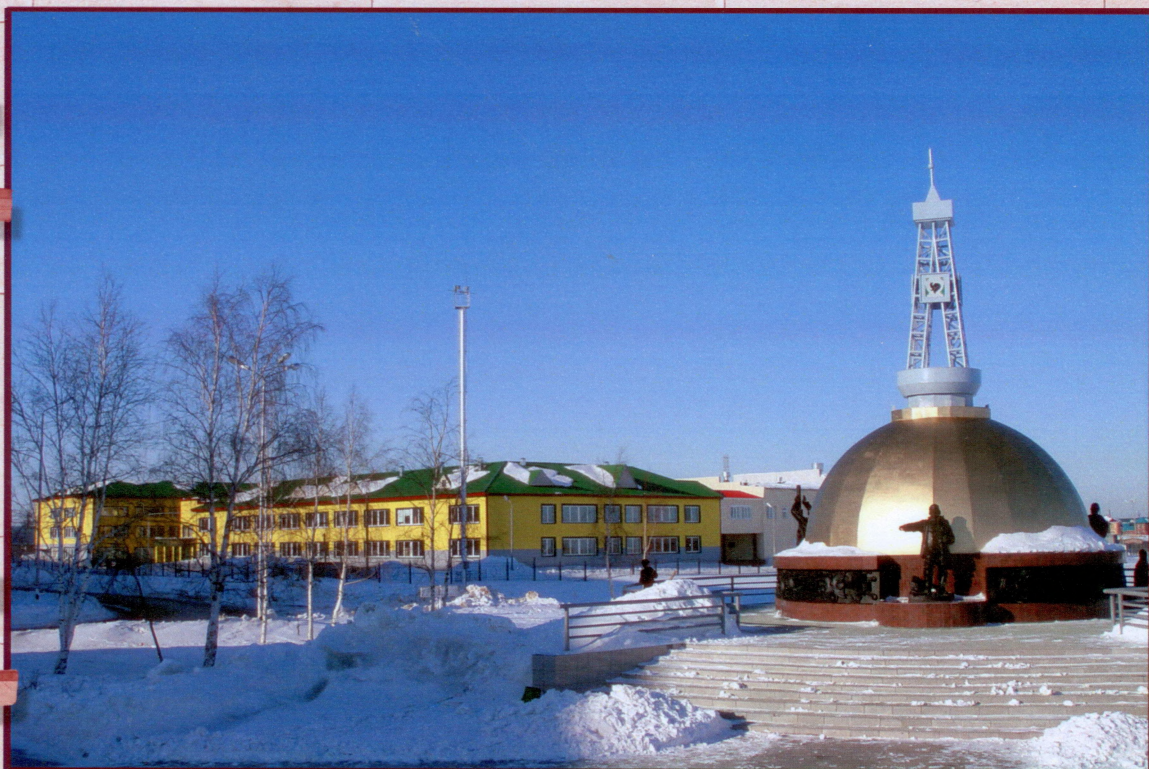
Монумент г. Мегион, ул. Кузьмина Сдан 25.07.2003 г.