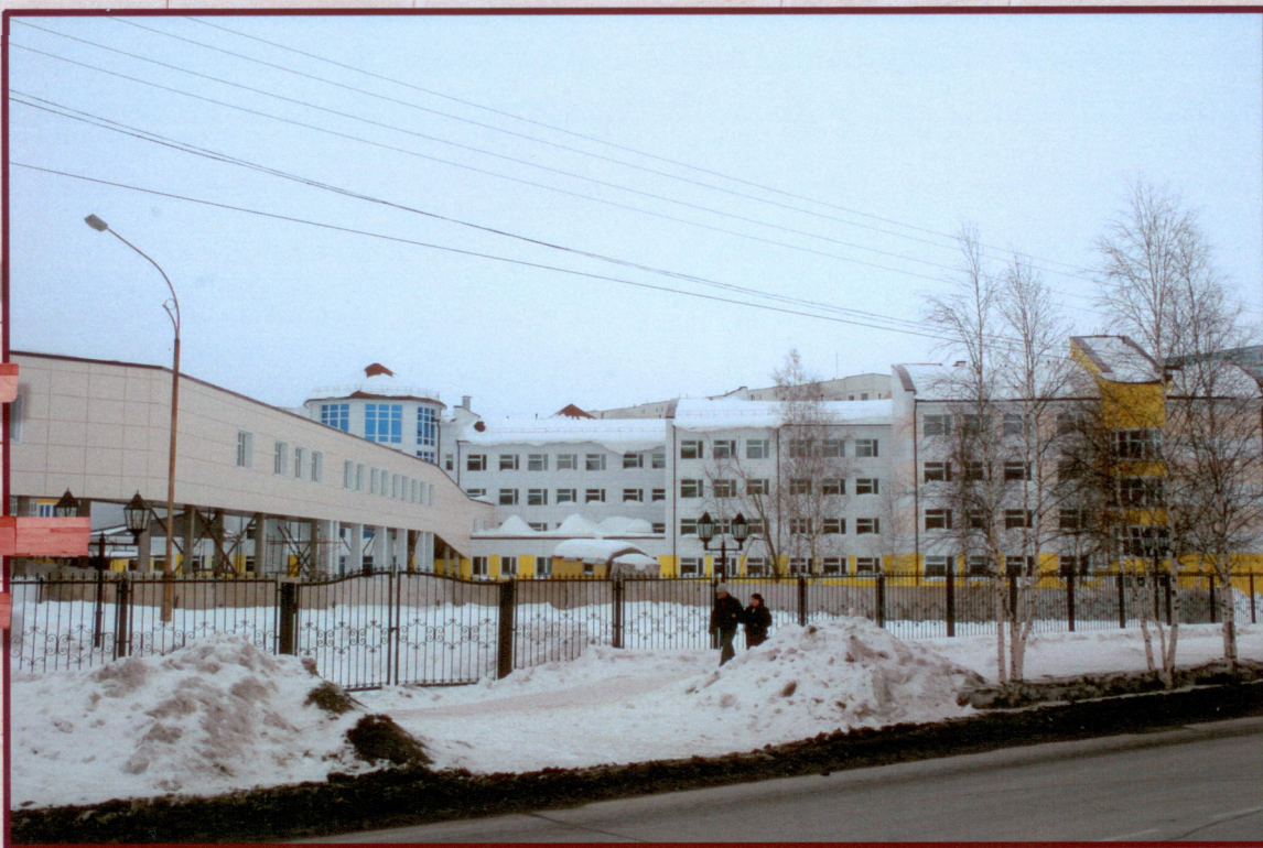
Средняя школа г. Мегион, ул. Свободы Строящаяся