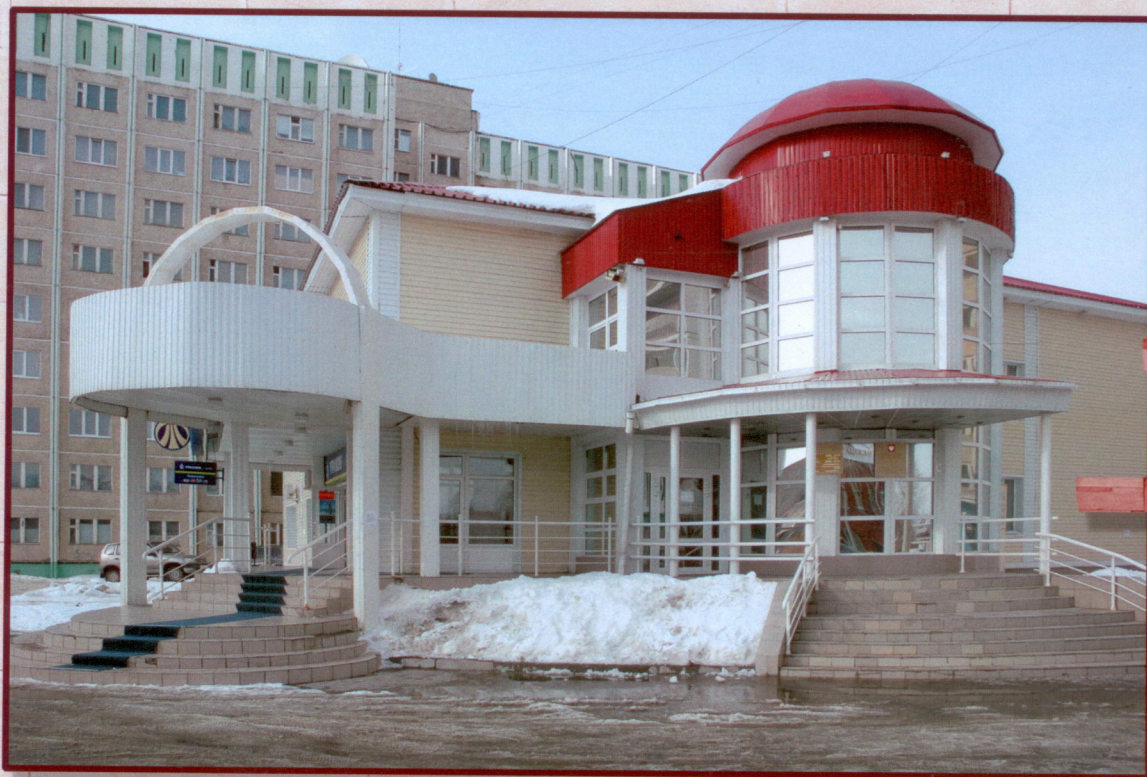
Административное здание ЗАГС г. Мегион, ул. Строителей, д. 2/6 Сдано 02.09.2005 г.