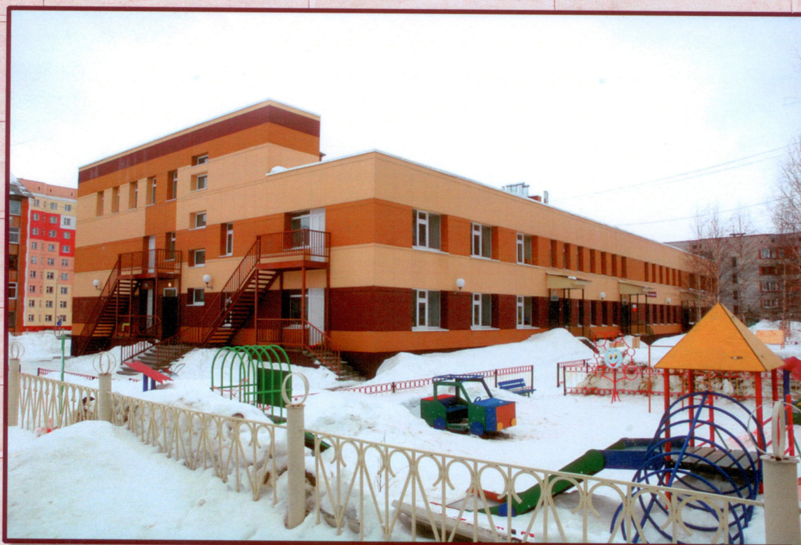
Капитальный ремонт детского сада "Ласточка" г. Мегион, Театральный проезд Сдан 27.12.2007 г.