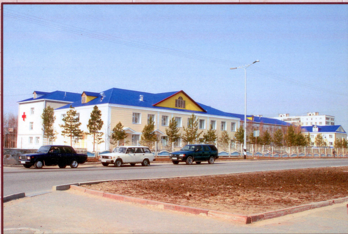
Капитальный ремонт роддома г. Мегион, ул. Заречная Сдан 25.12.2003 г.