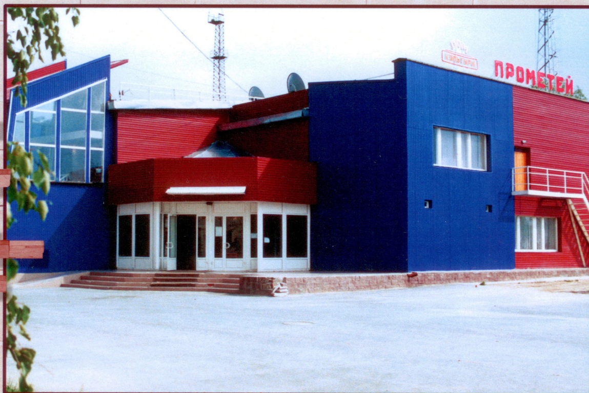
Реконструкция ДК "Прометей" г. Мегион, ул. Сугормина Сдан 01.12.1999 г.