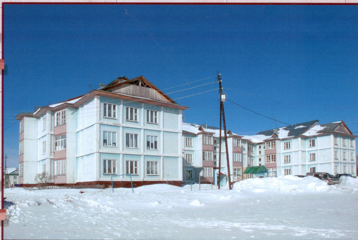
30 кв. жилой дом в п. Высокий Сдан 01.01.2000 г.