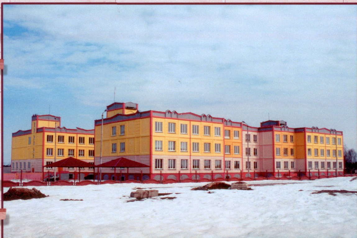
Школа на 600 учащихся п. Высокий Сдана 29.08.2000 г.