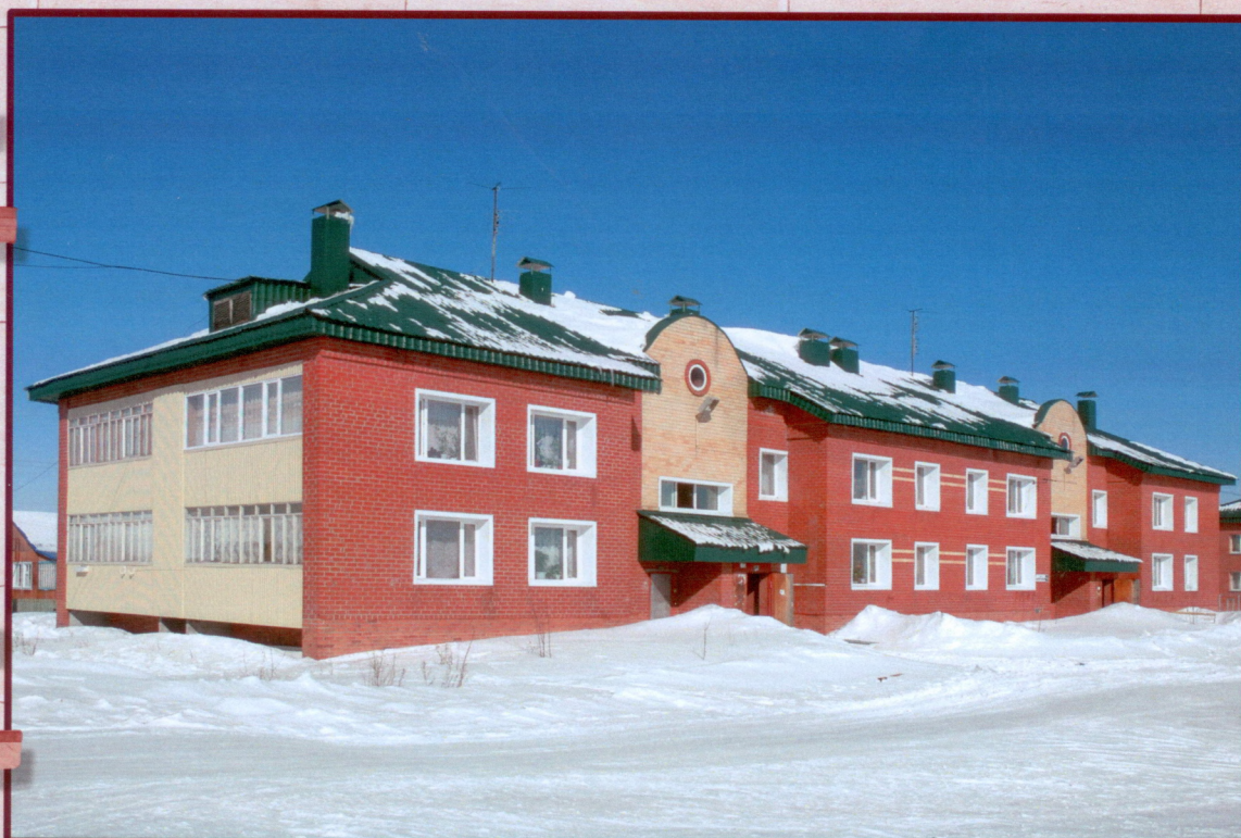
16 кв. жилой дом № 2 п. Высокий, ул. Амурская-Лермонтова Сдан 25.12.2002 г.