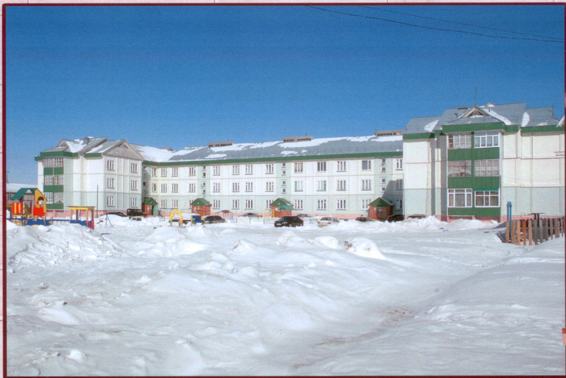
48 кв. жилой дом в п. Высокий Сдан 30.12.2001 г.