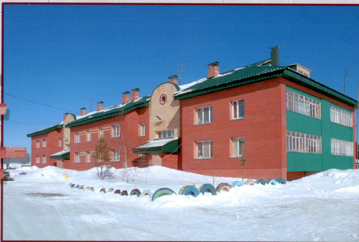
16 кв. жилой дом № 1 п. Высокий, ул. Амурская-Лермонтова Сдан 01.10.2001 г.