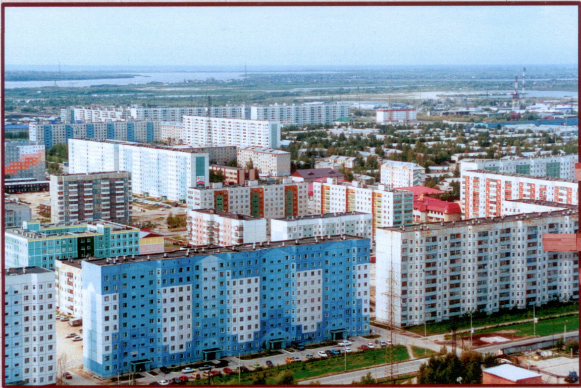
Жилой дом № 19 в 9 мкр. г. Мегион, ул. Кузьмина, д.10 Сдан 01.12.1997 г.