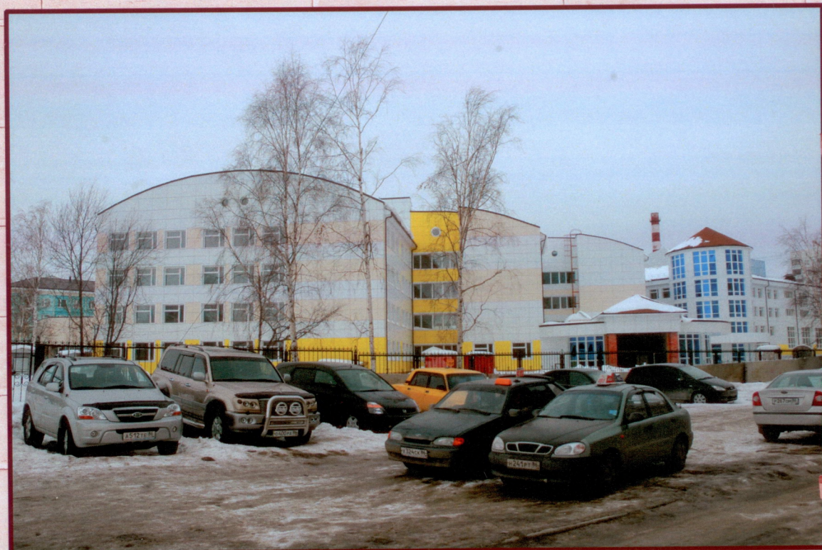
Средняя школа г. Мегион, ул. Свободы Строящаяся