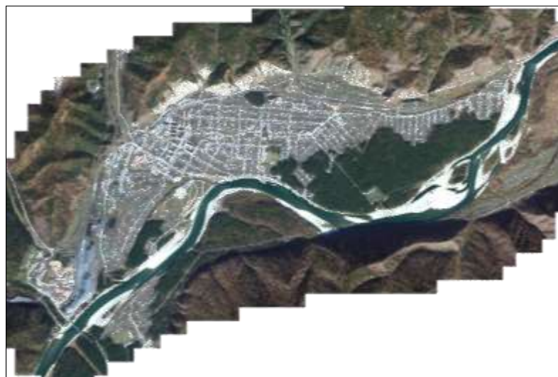
Рисунок 2. Космический снимок территории г. Абаза [2]